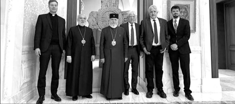
Ձախեն Գերարդեյի Հայր Փրօքր Ֆոխ, Գեր. Տ. Նաթան Ար. Յուկ հանդիսան, Վեհափառ Հայրադեթը, Դոկտ. Եոն Էյոնըր (CSI-ի նախագահ), Էրիս Վոնտոյել (Չուիցերիոյ Ախ անդան) եւ Ժոէլ Վելսկանի (CSI-ի փաստաբանական բաժանմունքի սնօրէն)

Նշենք նաև, որ Գուգուշը վերջերս հայտարարել է բեմին վերջնականապես հրաժեց չալու մասին՝ դրանով համարելով իր հայրենիքում կատարվող բռնությունները... Ա. Բ.