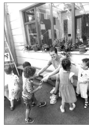
Դյունքը: Ոչ միայն այն, որ ինչ-որ մեկը գալիս է օգնելու, այլ նաև այն, որ այդ ճանապարհին ինքն է փոխվում: Եվ հաճախ՝ ընդմիշտ:

Թերեւս հենց սա է կամավորության ամենակարեւոր ար-