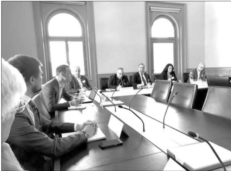
Բեռնում, աղրիլի 30-ի միսսից մի դրվագ