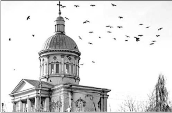
«ՎՁԳԻՅԱԳ» ռուսաստանյան գործարար թերթից Թարգմանեց Գ. ՄԿՐՏՅԱՆԸ

Հայկական սփյուռքը սեսնում է՝ ինչպես Հայաստանում սեղի են ունենում հալածանքներ եկեղեցու նկատմամբ: Այդ դաժնությունը այսօր հասկալի կարելի է, որ Հայ Առաքելական եկեղեցու հոգեւորականներն իրենց աջակցությունը հայտնեն հավասարակշռված, «Կզգայալ» թերթին ասաց Սուրբ Իսահակ եկեղեցու հոգեւոր հովիվ Տեր Հարություն Տերսերյանը: Կիրակի օրը Դոնի Ռոսովում սեղի է ունեցել հանրահավաք ի դաժնությունը Հայ եկեղեցու: