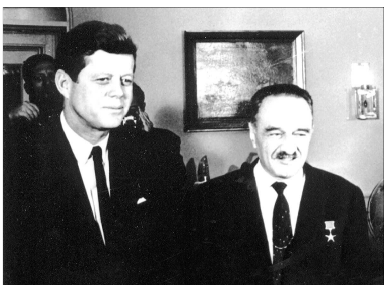
Ա. Գ. Միկոյանը ԱՄՆ նախագահ Ջոն Զենդերիի հետ Սոփիակ ամր: 1962 թվական, նոյեմբերի 28:

կասարել բարձրակարգ մասնագետը միայն: Գրքի հեղինակներից Սաս Նամինը՝ Անաստաս Միկոյանի թոռը, մշակութային աստիճանի ճանաչված գործիչներից է, որն ունի միջազգային ճանաչում: Անաստաս Միկոյանը սարք թոռ ուներ, բայց Սասն նրա ամենապրիորն էր: Միկոյանն ասում էր՝ նախ, որ տղա է, երկրորդ՝ հայրուհուց է: Այնուամենայն, Սաս Նամինը կասարել է ոչ միայն հսկայածավալ օգտակար, այլև շնորհակալ աշխատանք: Գրքում անդադարձ է կասարվում Անաստաս Միկոյանի մանկության ու հասունության ժամանակահատվածները՝ 1906-1917 թթ., ադա Բաբկի կոմունային՝ 1917 թ. մարտ-1919 թ. սեպտեմբեր, Նիժնի Նովոգորոդում եւ Ռոստովում աշխատանքի տարիներին՝ 1919-18 թթ., ԽՍՀՄ սննդի արդյունաբերության կազմակերպման աշխատանքներին՝ 1930-1941 թթ., Հայրենական մեծ պատերազմի տարիներին եւ հետպատերազմյան ժամանակահատվածին՝ 1941-1953 թթ.: Մեծագույն հետաքրքրություն են ներկայացնում Միկոյանի դերը ադասալիականացման ժամանակահատվածում՝ որդես խորհրդային դիվանագիտության հակաճգնաժամային կառավարիչ՝ 1953-1964 թթ., անդադարձ է կասարվում