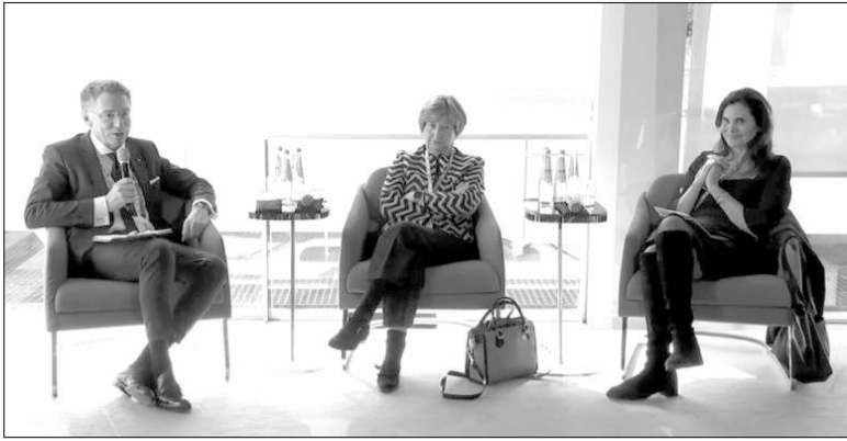
Պրոֆ. Զրիստոս Զաֆֆերիզյանը, Միջազգային ֆրեական դատարանի (ICC) նախկին նախագահ Սիլվիա Ֆերնանդես դե Գուրմենդին, The Reckoning Project կազմակերպության գործադիր սնտեն Զանին դի Ջիովաննին

⇒1 Հայկական դատարանական դատախազները Մյունխենում էր՝ արքեպիսկոպոսականից ավելի ներկայացուցչական, եւ Ալիեւի ներկա չլինելը մեզ շոտելուց նրա ֆախսական վերբալ ահաբեկչությունից կտրվել: Բայց ինչո՞ւ դրա մասին չհիշատակվեց Տարբեր բանավեճերի ժամանակ, երբ դա հիշվում էր ներկա հայ փորձագետ, վերլուծաբան, արտախորհրդարանական դեմքեր անգլերեն վարժ արտախոսվելու դժվարությունը չունեին: Խաղաղություն է սալիս մեզ դրացի դա հիշելը, այդ հեփաթն ենք ուզում մեր օրորոցայինը դարձնել, դրա՞ համար ձայն չենք հանում, թե՞ Մյունխենում միտք կրկնել, որ ազդեցության «սաղոգը» միայն Պուսիսին է կարում: