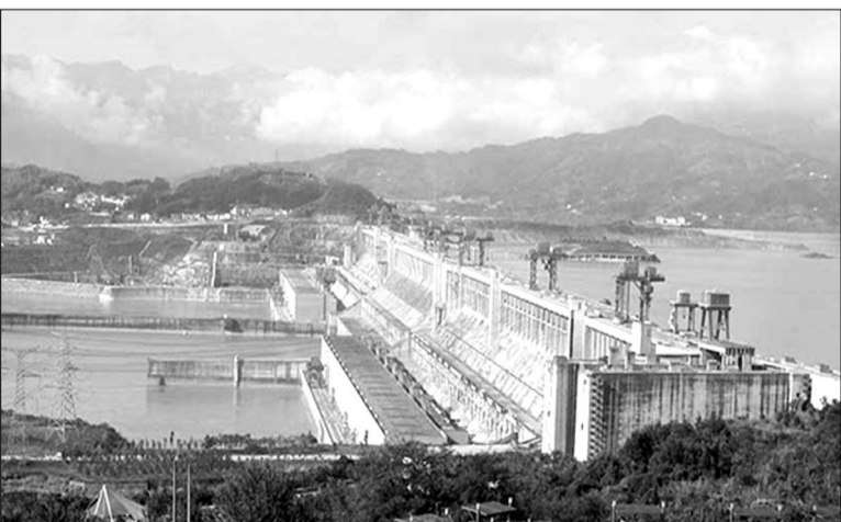
Աւխարհում հազարավոր հիդրոէլեկտրակայաններ կան: Փոքրերից, որոնք կարող են է-

լեկտրաէներգիա արտադրել մի ֆանի տան կամ գյուղի համար, մինչեւ հսկայականներ: Նրանք