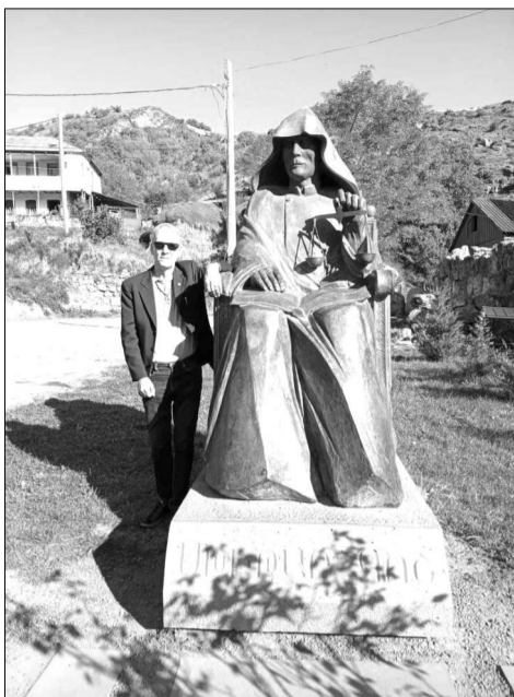
Սվանտե Լունդգրենը Մխիթար Գոցի արձանի մոտ Գոց գյուղում (2024):

ԵՐԵՎԱՆ-ԼՈՒՆԴ, Շվեդիա - Շվեդիայի մասնաճյուղի և գրող Սվանտե Լունդգրենը երայագիտության դոկտորի կոչում է ստացել Ֆինլանդիայի Արո Ակադեմիա համալսարանում: Առաջինը է որդես միջնակարգ դպրոցի ուսուցիչ, դասախոսել է Արո Ակադեմիայում: Երկար սարիներ եղել է Լունդի համալսարանի Աստվածաբանության և կրոնական հետազոտությունների կենտրոնի դասախոս և հետազոտող: Հետազոտությունները հիմնականում վերաբերում են Մերձավոր Արևելքի ոչ մահմեդական փոփոխություններին, մասնավորապես ասորիներին, հայերին և եզդիներին: Նրա գիտական հետախույզումները ներառում են նաև Հայոց ցեղասպանությունը և արեւմտյան միջին-արևելյան ու մարդասիրական գործունեությունը արեւմտահայերի ժողովրդում: Սվանտե Լունդգրենը շվեդերեն, անգլերեն և գերմաներեն մի շարք հոդվածներ է գրել հեղինակ է: