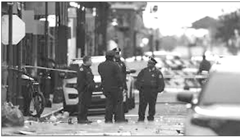
Նյու Օրլեանը՝ ահաբեկչական ակտից հետո

2001թ. սեպտեմբերի 11-ին Նյու Յորքում տեղի ունեցավ ահաբեկչական ակտ, որը իրականացրեց «Ալ-Զաիդա» ահաբեկչական կազմակերպությունը: Ահաբեկչական խումբը բաղկացած էր 19 անդամներից, որոնք բռնազավթեցին 4 ուղեւորներով լի ինֆանտրի: Զավթիչները բաժանվել էին 4 խմբի, ամեն խմբում կար մեկը, որը սովորել էր օդաչուների դասընթացներում: 2 ինֆանտրիներ բռնազավթումից հետո բախվեցին Մանհեթենի Զամաշխարհային առևտրի կենտրոնների 2 աշտարակներին, 3-րդ ինֆանտրի բախվեց Վաշինգտոնից ոչ հեռու տեղաբաշխված Պեն-