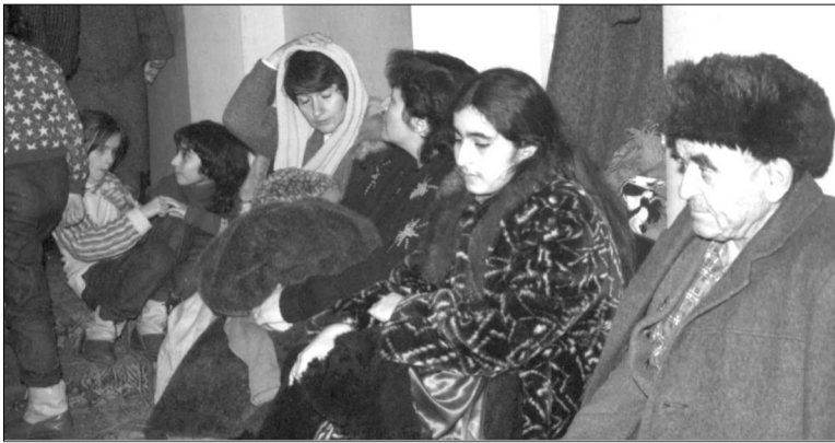
Բավի կոստրածից մազադուրծ հայերը Մոսկվայում 33 դիվանագիտական ներկայացուցչության սրահում: 1990 թվականի հունվար:

⇒1 ԽՍՀՄ փլուզմանը զուգահեռ Ղարաբաղի ինքնորոշված բնակիչները հայրենի երկրին միանալու կամային որոշում ընդունեցին, որին այդ ժամանակ Հայաստանից սաստեցին, հաղորդմանը մասնակից սոցիոլոգ Թեա Յոֆմանն է լրացնում: Նրա մեկնաբանմամբ Հայաստանից Ադրբեջան արտաքսված ադրբեջանցիները իրենց երկրի որ քաղաքում էլ հայտնվում էին, ասելու ինքնազուտն էին սարածում սեղի հայերի հանդեմ: 1988-ի փետրվարին Սումգայիթում առաջին սարսափելի կոստրածը եղավ, որին զոհ գնաց նվազագույնը 50 հայ: Սումգայիթում բազմաթիվ հայեր էին բնակվում: Նրանք արդյունաբերական այդ ֆաղա էին սեղափոխվել բնակվելու Ղարաբաղից՝ չհիմնադրված հայկական այդ քաղաքների հանդեմ խորհրդային Ադրբեջանի իշխանության կիրառած սնտեսական ճնշումներին: Բավում էլ հայերի թիվը մեծ էր: 1990-ի հունվարին արդեն Բավում բնակվող հայերը խորադեմ մտադրված էին ազգամիջյան լարված հարաբերությունները ծեղծելով: Հաղորդման հեղինակ Գուրմանը հունվարի 12-ի իրադարձություններին անդրադարձնալով հղում է անում Աբրամ Ալիսլի «Քարե երագներ» վիդեոյին, հասված կար-