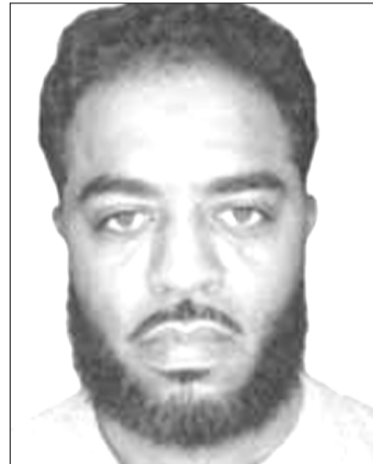
Shamsud din Jabbar Շամսուդին Զաբբար՝ ԱՄՆ Նյու Օրլեան ֆաղաֆագի տեղի ունեցած ահաբեկչական ակտի իրականացնողը

2025թ. հունվարի 16-ին (3-15) ուն 42-ամյա ԱՄՆ-ի ֆաղաֆագի Շամսուդ-Դին Զաբբար անունով, իր «Ֆորդ» մակնիշի (դիկաթ) մեքենայով մխրձվեց ժողովրդի բազմության մեջ Նոր Օրլեանի (ԱՄՆ) Բուրբոն փողոցում: Գետնամուկ սղանվեց 15 մարդ, իսկ մի քանի սասնյակ մարդիկ սարքեր աշխճանի