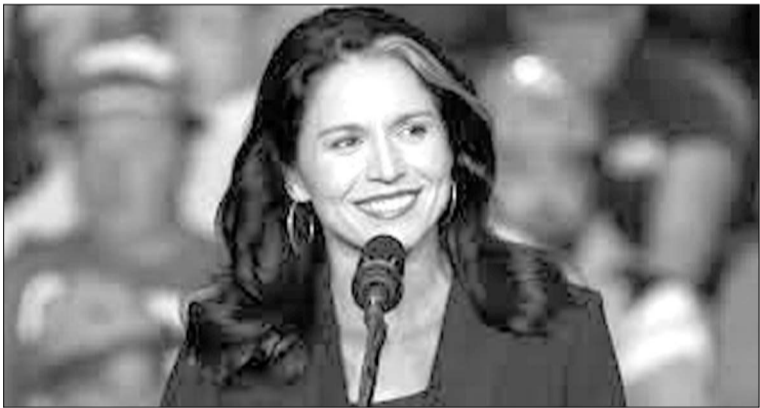
Tulsi Gabbard (Թուլսի Գաբբարդ). ԱՄՆ Ազգային հետախուզության սնորհ

Այդ մտքերը չի արհեստավորել որևէ հայ ֆաղաֆագե, ռուս վերլուծաբան կամ Թուրքիային ոչ բարեկամ որևէ ղեկավար: Միայն ֆաղաֆակալ վերլուծաբան: Այս մտքերը արհեստավորել է փոխգնդապետ Տուլսի Գաբբարդ (Tulsi Gabbard - Donald Trump s incoming Director