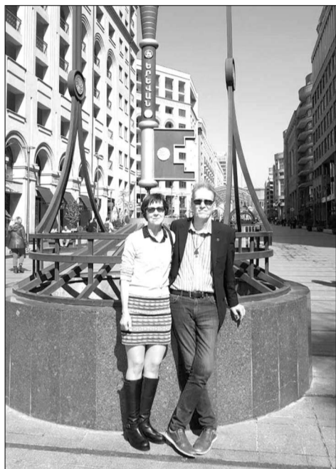
Սվանտե Լունդգրենը կնոջ հետ Երեւանում (2020):

-Ես նույնպես հուսով եմ, որ այդպես կլինի: Եվ միտ ունեմ Հայաստանին վերաբերող նախագծեր: 2024 թվականին զբոսաւորիկների երկու խումբ են բերել Հայաստան, եւս մեկով մտալի են գալ այս տարի: Այս մեկուսացրալ ճամփորդությունները բարձր են գնահատվում, եւ մասնակցներից շատերը դառնում են Հայաստանի իսկական բարեկամներ: