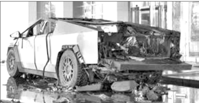
Լաս Վեգասում տայթեցված ավտոմեքենան:

էլ չեն համակրում ամերիկյան հասարակությունը եւ հասկալիս ֆաղափարական գործիչներին: Նրանց կարծիքով, սիրող հասարակարգը անսարք է իրենց նկատմամբ, զոհվածների ընտանիքների նկատմամբ, կորցված ժամանակի եւ առողջությանը նկատմամբ: Այս թեմաներով Հոլիվուդում նկարահանվել են բաղնաքիվ գեղարվեստական ֆիլմեր եւ ոչ անհիմն: Չի բացառվում, որ Թրամփի վերընտրումը հունից հանել է դաստիարակների մասնակից շահ վեճերում: Կարծես թե ամերիկյան հասարակության մեջ բեւեռացում է սեղի ունենում: Իհարկե, մե՛նք՝ հայերս, նույնպես ցավակցում ենք զոհված ամերիկացիների ընտանիքներին, հարազատներին, բարեկամներին, մանավանդ, որ դեռ չգիտենք զոհվածների թվում հայեր էլ կան, թե՛ ոչ: Միեւնույն է, նրանք բոլորը անմեղ զոհեր են: Հայաստան էլ սեւել է ծանր ահաբեկչություն: Ասված դաժնակի մեղ մեր փորձություններից: Ընթերցողս նկատեց, որ հողվածիս սկզբում մեջբերել են Տուլսի Հաբբարդի հայտարարությունը: Նա հունվարի 20-ից հետո կարգադրեցին ամերիկյան կառավարության կարելու ազդու դաժնակներից մեկը եւ Երդողանին համարում է ԱՄՆ-ին ոչ բարեկամ, անվանում է նրան դիկտատոր խալիֆ: Արդյո՞ք սա կՆերի Երդողանը: Արդյո՞ք այս ահաբեկչական ակտերը դասախոսական էին: Արդյո՞ք «Իսլամական դեմոկրատիա» կազմակերպությունը հասուկ հանձնարարություն չի ստացել: ՀԳԲ-ի, ոսիկանության եւ հետախուզության համար սա բավականին դժվար հետախուզություն կլինի, մանավանդ, որ սուբյեկտները սղանված են: Միեւնույն ժամանակ ուզում են հայտնել, որ նորընտիր նախագահ Թրամփը հայտարարել է «Նախագահ