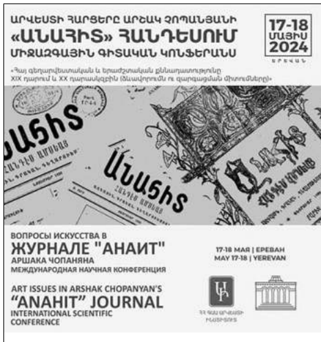
կունքներում:», - ասաց Աննա Ասատրյանը:

«Առաջին անգամ հայ ակադեմիական արվեստագիտությունն անդադարում է հայ յարբերական մամուլին՝ «Անահիտ» հանդեսի օրինակով: Հայտնի է, թե ինչ ծանրակշիռ նշանակություն է դեր ունի հայ յարբերական մամուլն արվեստագիտության, արվեստի ֆունկցիայի ձեւավորման, կայացման եւ զարգացման գործում: «Անահիտ» հանդեսը հրատարակել է ոչ միայն հոդվածներ Կոմիտասի գործունեության վերաբերյալ, նրա համերգային օրագրությունների մասին, այլ նաեւ Կոմիտասի գիտական հետազոտությունների արդյունքները: Այնպես որ, երաժշտագիտության մեջ Չոփանյանը կանգնած է կոմիտասագիտության ա-