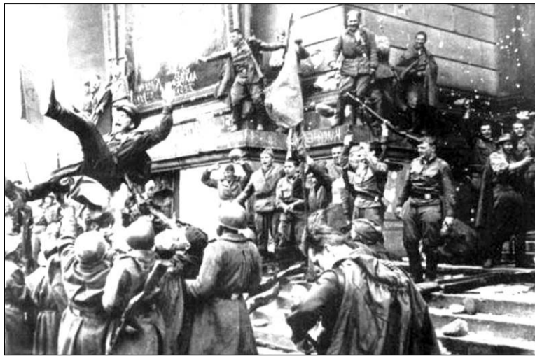
Կառույց գիծ կոչվող դիրքապնակում կռվեցին:

Հոկտեմբերի 26-ին դիվիզիայի զորամասերը կուբանյան դիրքապնակում կռվեցին Լյուբլին քաղաքից ոչ հեռու գտնվող Կամուսարա՝ նախադասարանները անցրեցին Կառույց գիծ կոչվող դիրքապնակում: