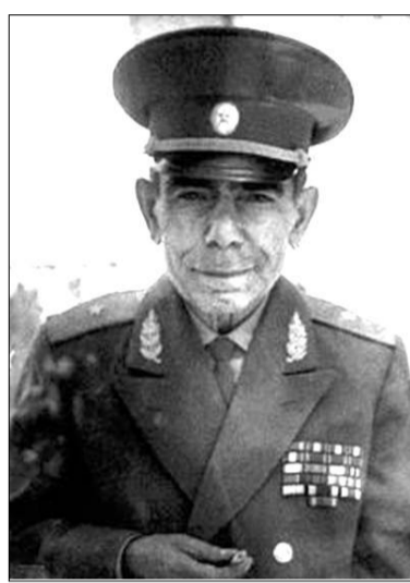
ՍԻՄՈՆ ԵՍԱՅԱՆՆ Առաջագծի, աշխատանքի, զինված ուժերի եւ իրավաստի ղեկավարող ղեկավարող միության հանրապետական խորհրդի նախագահ

Շարունակվելով հետադուրեղ թեքվեցին 89-րդ դիվիզիան անցավ Բեռլինի փողոցների գրավմանը: 89-րդ հայկական Թամանյան