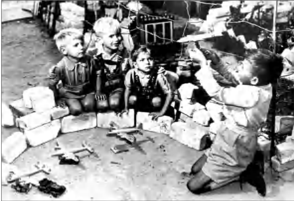
Սա 1948 թվականի հայտնի լուսանկար է, որ դասվում է, թե ինչպես է բեռլինցի երեխաների հիշողության մեջ ամրակայվել օդային կամրջով իրենց հասցված օգնությունը: Նրանք նույնը վերաբարձրում են խաղի միջոցով: