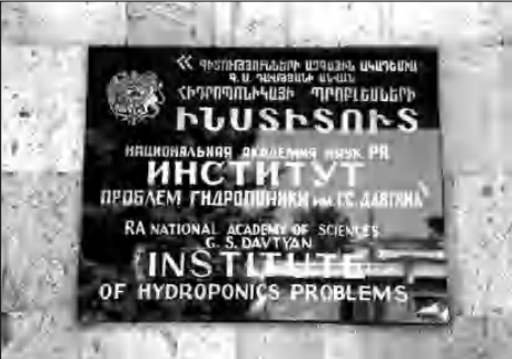
ՀՀ ԳԱԱ Գ.Դավթյանի անվան հիդրոպոնիկայի ժոնեմիալ ինստիտուտի գիտնականների կողմից մշակվել են ճարտ-

Մշակվել են նաեւ ռադիոդատարանիչների գործնական առաջարկներ, որոնց կիրառումը հիդրոպոնիկայում եւ ազոտադատարաններում կադախիլի ռադիոլոգիադատարանում անվտանգ բուսատեխնոլոգիայի ստացում (դեկավար՝ գ.գ.թ. Լ. Ղալաջյան): Գիտական ուսումնասիրություններն ինստիտուտի աշխատակիցների կողմից Երկրում անվտանգ: Մեկնաբան ՊԵՏՐՈՍ ՎԱՐՊԵՏՅԱՆ , Տեխնիկական գիտությունների թեկնածու