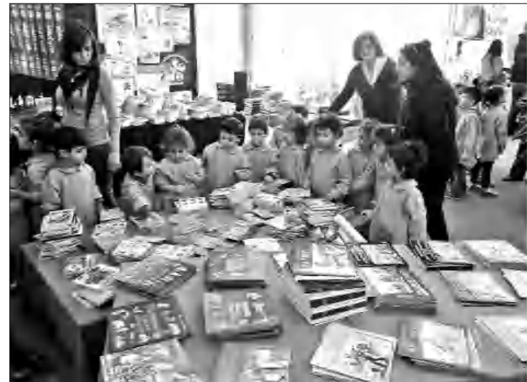
Գրավել ընթերցողներին վաղ սարից. «Կիլիկիա» հրատարակչությունների խաղադրույքը

«Կիլիկիայի» հրատարակած հայ դասականների հավաքածուն, որ ճանաչելի է կադույս կազմով, գրդանին հարմար փոքր ձեւաչափով, մեծ հաջողություն ունեցավ Սիրիայի եւ Լիբանանի, առհասարակ Սփյուռքի հայկական դրոցների աւակերտների ւրջանում: Երվանդ Օսյան, Հակոբ Պարունյան, Րաֆֆի, Համաստեղ, Անդրանիկ Ճառուկյան, Վիլյամ Սարոյան, Արամ Հայկազ եւ այլք սեղ են գտել այս դասընթացում: Սակայն 2012 թվականի աւանանը, երբ դասերս գրեցին անդերը խաւարեցին Հա-