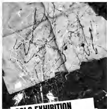
SOLO EXHIBITION November 13

Նոյեմբերի 13-ին էլ «ArtKvartal»-ը ներկայացրեց երկու տարբեր Գայ Ղազանյանի «IUVENIS» -ը (Երիտասարդություն) եւ Արսու Պետրոսյանի գործերի ցուցադրությունը: