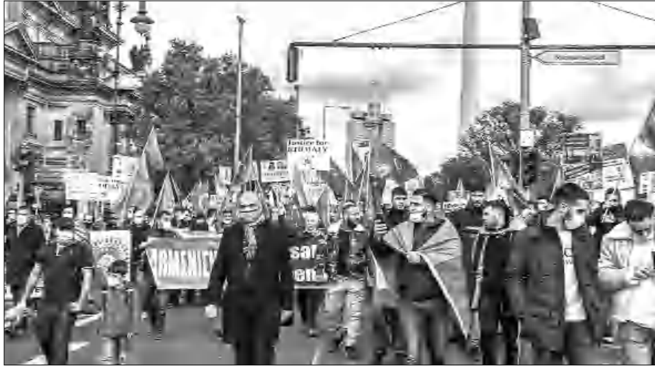
Արդեթանցիների բողոքի ցույցը Բեռլինում, 2020 թվական

Գերմանիան խոսում է խաղաղությունից, որտեղ մենք չկանք: Հայաստանը շրջել է այդ խոսույթը կամ՝ սկսել 0 կետից