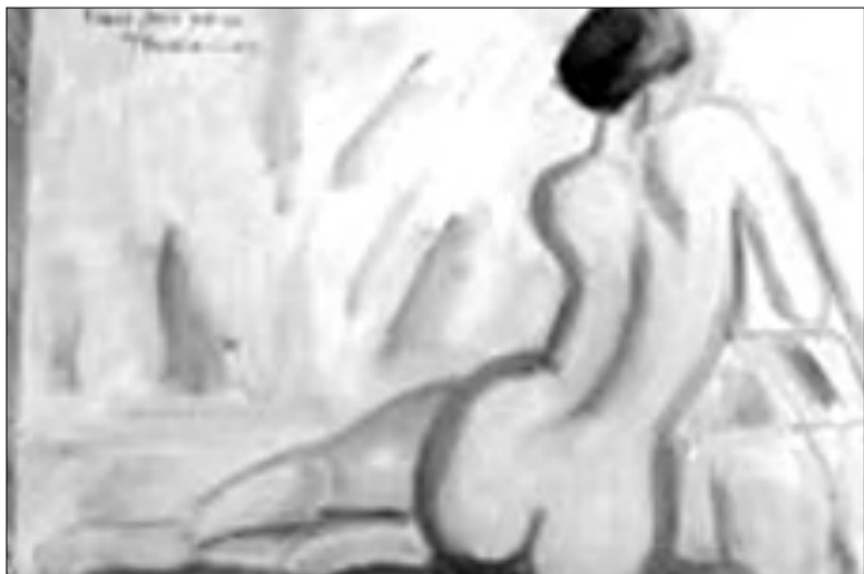
11 յունուար 2022, Նոազի-լը-Գրան