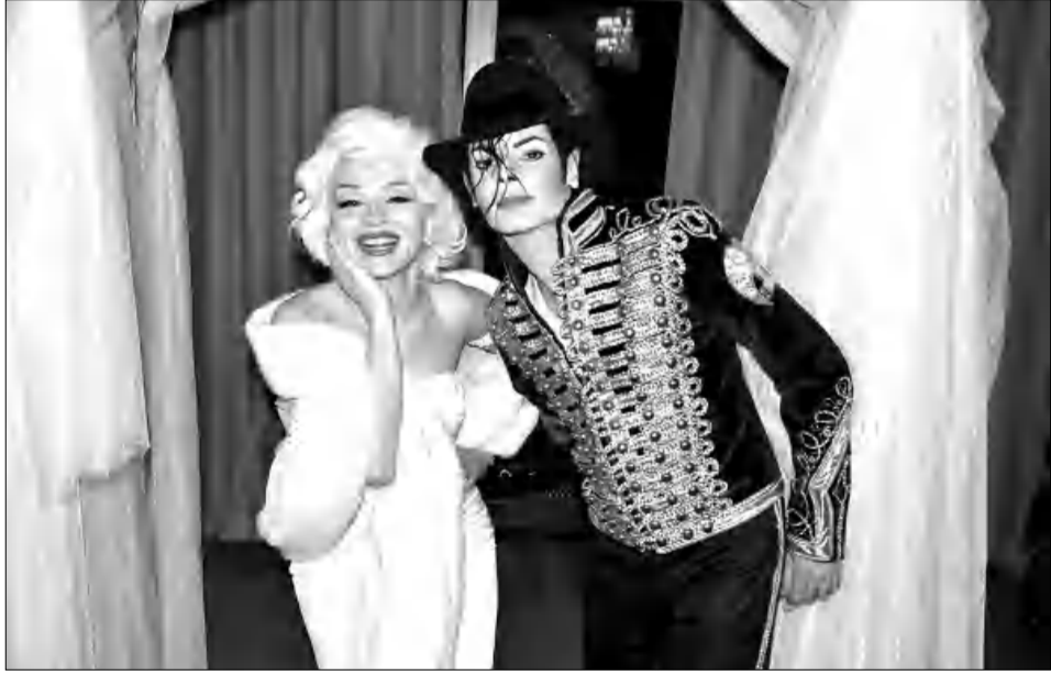
Պապ Ջեֆսոնը Մերիլին Մոնրոյի նմանակի հետ

Չանը օգնում էի ընսանիֆս, թարմացում էի ռեկվիզիտը, դիտում էի ենթագրերով կինոնկարներ: Երբ միջոցառումներ անցկացնելու թույլություն եղավ, մորից սկսեցի հյու-