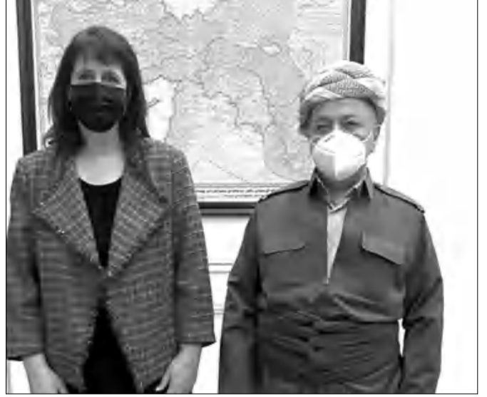
Զուրքիսանի ժողովրդի կրնական ազատութիւնների հանդէպ վերաբերմունքին, հանդուրժողականության ավանդույթներին առնչվող խնդիրներ»:

Ահա թէ ինչ է գրած. «Հյուսիսային Իրաքի ֆրակական վարչակարգի նախագահ Բարզանին, ընդունելով ԱՄՆ-ում հանձնաժողովի նախագահ Maenza-ին, վերջինի հետ լուսանկարվեց «Ասիական թուրքիայի նոր բարեգի» առջեւ, որը հենց այդպէս է անվանվել: Քարեգում թուրքական սարածները բաժանվել են մի ֆանի մասի՝ արեւելյան վիլայեթները կոչվում են Հայաստան, իսկ հարավ-արեւելյանները՝ Զուրքիսան: Ամերիկացի հյուրին ընդունելուց հետո սոցցանցում արած գրառման մէջ Բարզանին նշել է, որ մեծ գոհունակությամբ է հյուրընկալել Nadine Maenza-ին, նրա հետ բազմաթիւ այլ հարցերի թվում ֆննարկել է նաեւ Զուրքիսանի ժողովրդի կրնական ազատութիւնների հանդէպ վերաբերմունքին, հանդուրժողականության ավանդույթներին առնչվող խնդիրներ»: