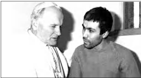
Հոնոնի Պատ Հոկհաննես Պողոս եւ Մեհմեդ Ալի Աղջա

Այս միջադեպից հետո ռուս-թուրքական հարաբերությունները մոտավորապես 9 ամիս ճնշեցական եւ ֆաղափարական ճգնաժամի մեջ էին, սակայն 2016թ. հունիսին Երդողանը դաժանաբան ներողություն խնդրեց նոյեմբերի 24-