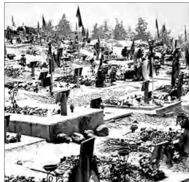
եղել: Մենք երբեք իմենք մեզանից այսօր բաժան ու իմենք մեզ հետ այսօր անհաճ չենք եղել:

Ողբի՛ հայրենիք, որբի՛ հայրենիք... Թունանյանի խոսքերն են դրսևորում՝ արիս մեջ, որը հիմա ճախ է սկել: Մեր սրտերի վերքը, հե՛տքը, վիճը երբեք այսչափ մեծ չի