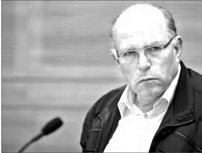
Անգլ. քարզմանեց ՏԱԿՈՒԹՅԱՆԸ

Վերնագրի այս խոսքերով է ավարտել «Ջերուսալեմ փոս» հրեական թերթի գլխավոր ֆաղափական թղթակից Գիլ Հոֆման (Gill Hoffman) հեռախոսով Ադրբեջան հարաբերությունների վերաբերյալ իր առանձնահատուկ հարցազրույցը իսրայելական գաղտնի ծառայության՝ Մոսադի նախկին ղեկավար և Ազգային անվանագության գծով նախկին (2009-2011) խորհրդական Ուզի Արադը (Uzi Arad), որն իր ծառայությունների 48 տարիների ընթացքում բազմաթիվ ձգձգված միջոցառումներ է անցկացրել, մասնակցել գաղտնի օդերային անվանագության հարձակումներ, բացահայտել նրանց կենտրոնները և հանդիպումներ ունեցել Իսրայելի թեմաթիվներին: