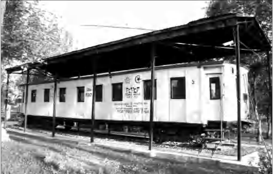
Գնացի վազոնը, որտեղ ստորագրվեց Տխրահռչակ թայմանագիրը:

4. Թուրքիայի, Ադրբեջանական եւ Հայկական ԽՍՀ-ների կառավարությունները համաձայնում էին Նախիջեանի մարզը՝ որդես ինքնավար տարածք, հանձնել Ադրբեջանի խնամակալությանը (հոդված 5):