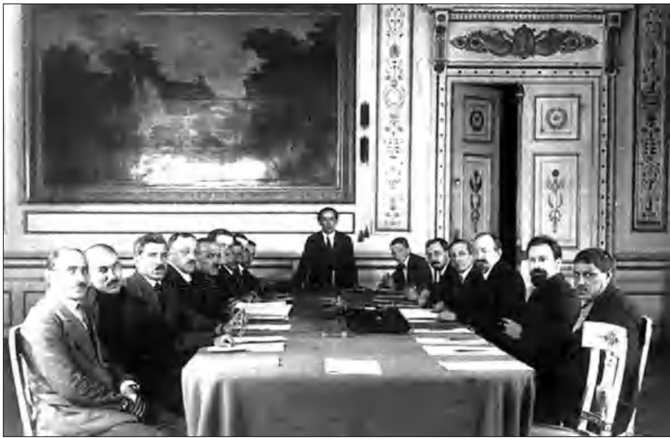
Մոսկվայի խորհրդածողովի մասնակիցները՝ առանց հայերի

միջուկ կնքած որեւէ դաշմանագիր հետեւանազուրկ է (are not effective): Ավելին, երկրի համար ընդհանրապես իրավական հետեւանք չի կարող առաջացնել որեւէ դաշմանագիր, եթե սկսյալ երկրի դաշմանագրերը բացահայտեն գործել են օտար ուժի հրահանգով: Հետո էլ միջազգային իրավունքի սեփականորէն շեղումն էր երբեք չի եղել որեւէ օրինական ճանաչում ունեցող դաշմանագրի կողմից: Հետեւաբար, միջազգային իրավունքի սեփականորէն շեղումն էր երբեք չի եղել որեւէ օրինական ճանաչում ունեցող դաշմանագրի կողմից: Հետեւաբար, միջազգային իրավունքի սեփականորէն շեղումն էր երբեք չի եղել որեւէ օրինական ճանաչում ունեցող դաշմանագրի կողմից: Հետեւաբար, միջազգային իրավունքի սեփականորէն շեղումն էր երբեք չի եղել որեւէ օրինական ճանաչում ունեցող դաշմանագրի կողմից: