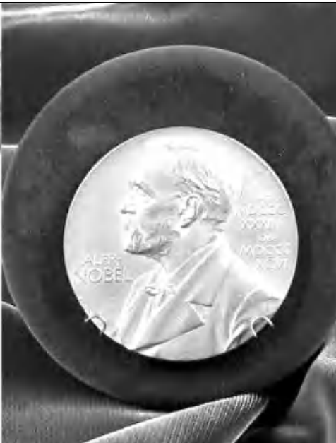
Նորահայտ զգայարանի միջոցով ինչո՞ք են ազդակներ հաղորդում նյարդային համակարգին՝ գրավել է Նոբելյան մրցա-

նակաբաժնույթյան կազմակերպիչների ուժադրությունը: Ենթադրվում է, որ այս հայտնագործությունը աղաճայում հսկայական ազդեցություն կունենա ցավի մեղմման եւ ամոքման հարցերում: