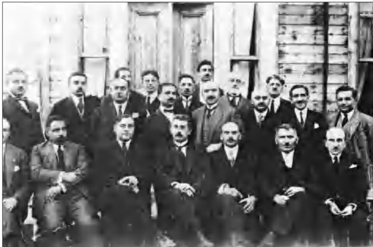
ՌԱԿ Ա ընդհանուր ղայտնափոխական ժողովի մասնակիցները, Պոլիս, 1922