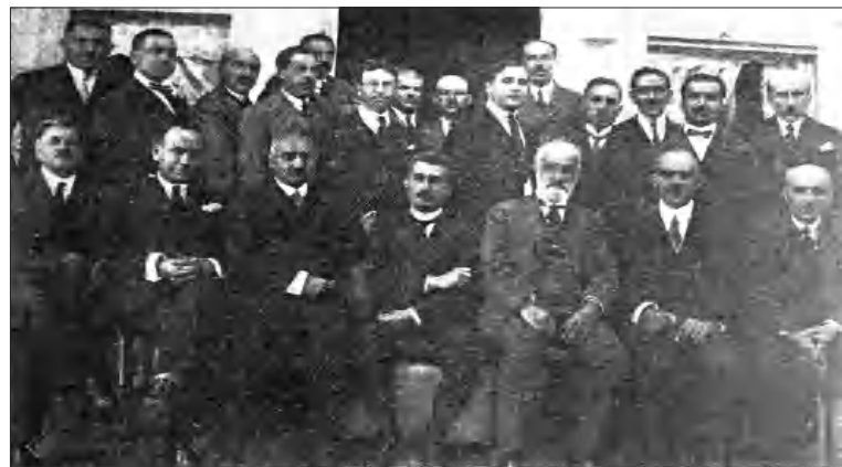
Ռամկավար Ազատական կուսակցութան առաջին ընդհանուր ղայտնափոխական ժողովի մասնակիցները, Պոլիս, 1922

Միության բանակցություններ- ըր գրեթե զուգահեշաբար ընթա- նում էին նաեւ ռամկավարների ու վերակազմյալների ամերի- կյան հասկանների միջեւ եւ մե- տական կաղ եր ղայտանվում նրանց ու Կ. Պոլիսի կենտրոնների հետ: Երկար ֆնարկումներից ու բանավեճերից հետո, մասնավո- րապես միմյանց հասցեին կու- սակցական ղայրերականներ- ում (ռամկավարական «ժողո- վուրդի Ձայն» եւ ազատական «Առավոտ») ինչան ոչ տեղին ու անհարկի փոխաղարձ մեղաղ- րանքների խնդիրը հարթելուց հե- տո 1921թ. սեպտեմբերին միու-