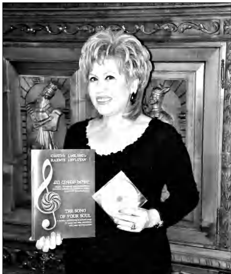
ձայնագրությունների: «Չվարթնոց» իմ ստեղծած միակ անսամբլը չէ, ստեղծագործական գործունեությանս ընթացքում մի ֆանոն նվագախումբ ու անսամբլ են հիմնել, որոնց հետ իմն էլ շատ անգամներ են ելույթ ունեցել, ի դեպ՝ հիմա էլ:

Արդեն 7 տարի է դասավանդում եմ նաեւ Հայկական ղեկավար մանկավարժական համալսարանում: Ստեղծել են ուսանողներից կազմված ֆանոնահարների «Չվարթնոց» անսամբլը, որն ակտիվ մասնակցում է սարքեր համերգների,