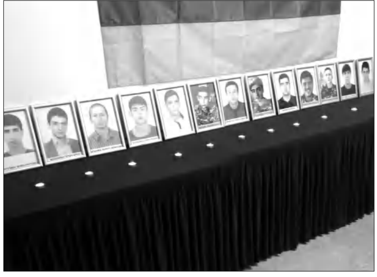
Մեր կողմից որոշում կա Ակադեմիայի տարածքում հուշարձան կառուցելու մասին: Դասերազմում զոհված մեր ուսանողների հիշատակին՝ մեր ճարտարապետները, ֆանիսկազորների, բոլորիս մասնակցությամբ»: