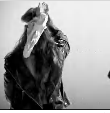
«Կանայք» (2018)

կարելի է թարային ժառանգությունը նշել առանց բնօրինակ ստեղծագործության տեսողական հետքերի: «Մարգարեուհին» Հալփրինի առաջին մեմահամարներից էր, ստեղծված 1947 թվականին, Ա-