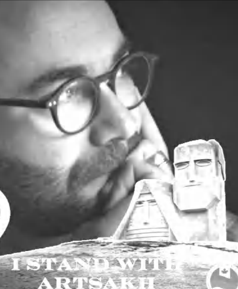
ISTAND WITH ARTSAXH