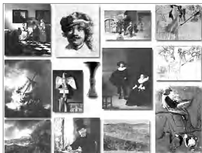
Գողացված արվեստի հավաքածուն

Ելոթը հրասարկության դասրաստեց՝ ՆԱԿՈՔ ԾՈՒՆԿՅԱՆԸ (The Arm. Mirror-Spectator)