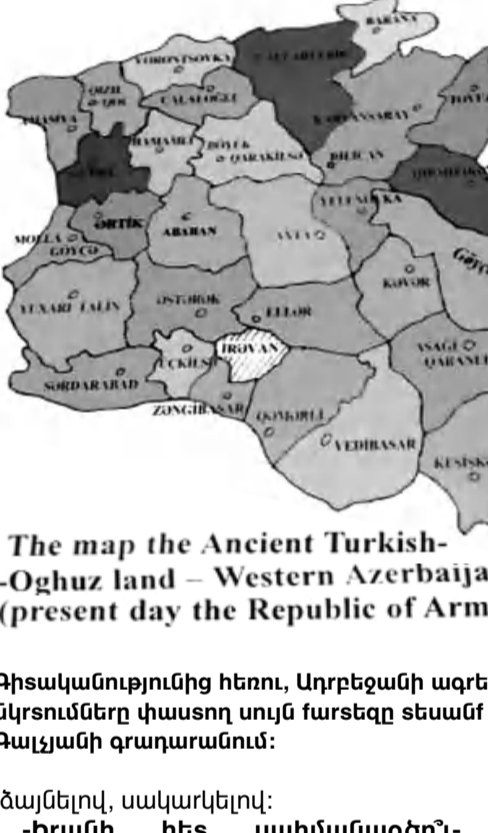
The map the Ancient Turkish-Oghuz land – Western Azerbaijan (present day the Republic of Armenia )

մեր ձեռքում եղած անկլավները միջակ մեզ մնան, Արծվաբենը իրենց ձեռքն է, թող իրենց մնա: Այս խնդրի օրու խոսել ենք տարբեր մասնագետների հետ, բոլորը համաձայն են, որ սա այսպես մնա: - Դուք երկար ժամանակ բնակվել եք Լոնդոնում, հիմա Երեւանում եք ապրում: 2020-ի դաժանաբանի կազմակերպիչների մասին տարբեր կարծիքներում քաջանառվում է Մեծ Բրիտանիայի անունը: Դուք նշեցիք, թե մեր գիտնականների ստեղծածը չի թարգմանվել, չի ներկայացվել աշխարհին: Այդ դուրսդուրե՞նք մի երկրում, որի անունը քաջանառում են դաժանաբան հրահրելու մեջ, մենք գիտնականների մեջ բարեկամ ունե՞նք, որ կարող են սահմանների ձիւս գծման հարցում օգտակար լինել, ձայն բարձրացնել: «Չկան մշակական բարեկամներ» ասույթը, կարծում եմ, գիտությանն այնքան էլ չի վերաբերում: