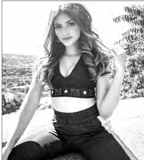
Շրուտի Սինհան Երեւանում

Վերջերս Հայաստանում էր հնդիկ ժամանակակից սիրված դերասանուհի, դարուհի եւ երգչուհի, հնդկական հեռուստատրիայների ասոլ Շրուտի Սինհան : Երիտասարդ արտիստուհին, որ մեծ ժողովրդականություն է վայելում հասկադես հնդիկ երիտասարդության Երջանում, Հայաստանն է ընտրել որդես իր նոր սեսահողվակի նկարահանման վայր: Շրուտի Սինհայի նոր սեսահողվակի նկարահանումները կատարվել են Երեւանում, մասնավորադես՝ «Հադթանակ» զբոսայգում: Երեւանում բարձրագույն կրթությունը ստացող հայրուրավոր հնդիկ ուսանողները մեծ ոգեւորությամբ են ընդունել հայրենից եկած ասոլին: