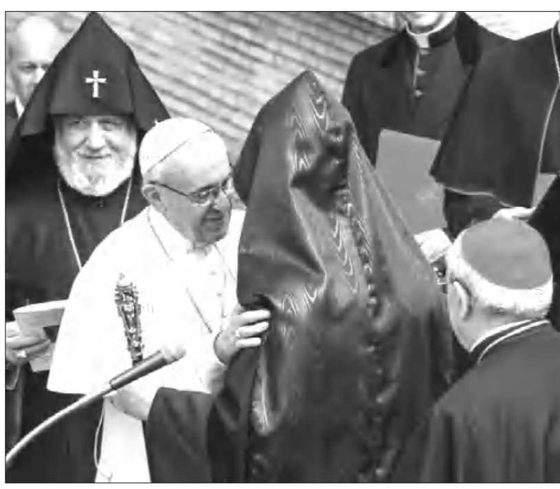
Պատրիարքը ողջագուրվում է Սեփի Տանն Կիլիկիո Արամ Ա կաթողիկոսի հետ, 2018 թ. Հոռնում Ա. Գրիգոր Նարեկացու բրոնզե մեծ արձանի բացման ժամանակ: Սեփին՝ Ամենայն հայոց հայրապետը:

⇒ 8 1895 թվականից սկսած, համի-դյան շարժերի ընթացքում, նա շատ մեծ արժեքի ձեռնարկեց՝ դաստիարակելով տեղի ունեցող վայրագությունները: Նա հայ տոնախմբության ֆինանսական եւ ֆաղափական օգնություն սրամարտեց: Նրա բազմաթիվ աշխատություններ (այդ թվում՝ «Հայ մահա-սակների անվանացանկ, Հայաստանի կոն-րաժների դաստիարակական աղյուսակ»[2], 1896), կազմակերպության տեղեկագրում տպագրված հոդվածներն, ինչպես նաեւ նրա նամակագրությունը եւ ուսումնասիրու-թյունները վկայում են հայ ժողովուրդի նկատմամբ այս եկեղեցականի սածած ջերմ գործի մա-սին: Հավասարի մնալով իր աշխարհիկ ա-վանդույթին՝ Oeuvre d'Orient-ը նույնիսկ 24-ին օժանդակության հիմնադրամ բացեց՝ օգնելու համար արցախցի հայ փախսա-կաններին եւ այնտեղ մի ֆանի առաքելու-թյուններ կատարեց[3]: