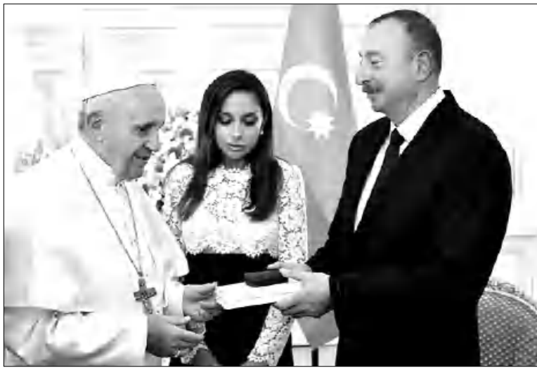
Ալիևի զույգի եւ Զահանյաթեյի նվերների փոխանակումը: Հռոմի Ֆրանցիսկոս ղաղափարի եւ բնագրի զույգի միջեւ կարծես ամեն ինչ լավ է... Միամտություն, թե՛ կուրություն: