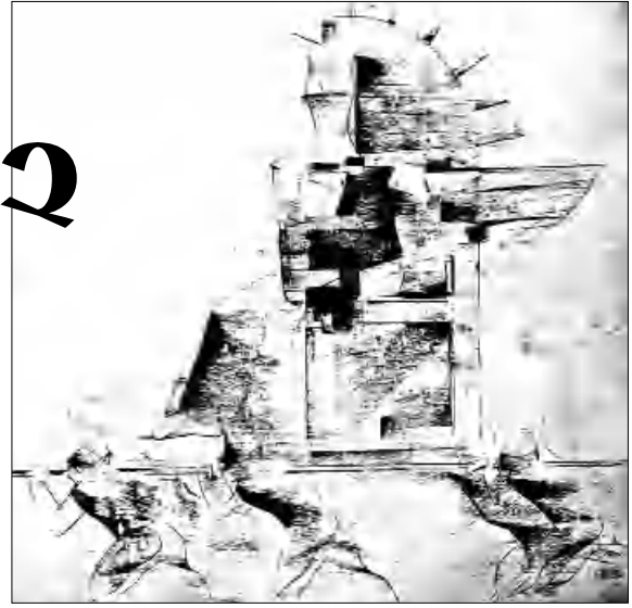
«Նոր Աստվածություն» (2009 թ.)

վեստական խմբակ, հրադուրվել Լեոնարդո դա Վինչիի ստեղծագործություններով եւ անսիկ Հունաստանի արվեստով: 1970-ական թվականներին հաճախել է Մանկական գեղագիտական կենտրոն, ապա ավարել Փանոս Թերլեմեզյանի անվան գեղարվեստի ուսումնարանը, 1985-ին՝ նաեւ գեղարվեստաթատերական ինստիտուտը եւ նույն տարում ունեցել առաջին ցուցահանդեսը՝ Երևանի նկարչի սանը: Նա հրադուրվել է նաեւ զբոսայգիի ձեւավորումով եւ ավելի քան 20 զբոսայգիի ձեւավորումով: Դրանց թվում է Հ. Թումանյանի «Սուսիկ ուսկանը» հեփաթը, որը 1979-ին բանաստեղծի ծննդյան 110-ամյակի առթիվ տպագրվել է Երևանում, ներկայացվել Մոսկվայի զբոսայգիի միջազգային ցուցահանդեսում եւ տպագրվել նաեւ օտար լեզուներով (անգլերեն, գերմաներեն, ֆրանսերեն եւ այլն):