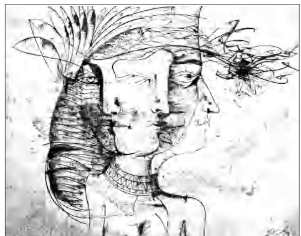
«Երեք դեքս» (2007 թ.)