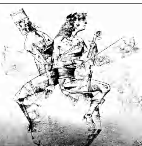
«Օրիտուն ու Սիգիփոսը» (2007 թ.)