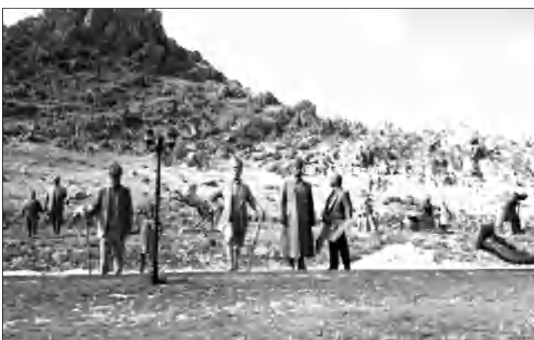
որը Մեծն Կոնստանտինոսի Զոյթափայից զսնվում է մոտ 100 կմ հեռավորության վրա: 14-րդ դարի սկզբին ֆաղափում արդար էր մոտ չորս հազար հայ աչի ընկնելով հասկադես

Տարիներ ցարունակ ժամանակակից Թուրքիայի Էսփիեհիի նահանգի Սիվրիհիսար ֆաղափում զսնվող Սուրբ Երրորդություն եկեղեցու բակում ցարունակաբար տեղադրվում են հայտնի թուրք գործիչների արձաններ: Այս դաստիարակ եկեղեցու բակի կենտրոնական հասկածում տեղադրված են Մուսաֆա Զեմալ Աթաթուրքի արձանը, հարակից տարածքներում՝ Զյազիմ Կարաբեկի փառայի, հայտնի գրող Յաւար Զեմալի եւ հայտնի զվարճախոս Խոջա Նասրեդինի արձանները: Սիվրիհիսարը հիմնադրել է Բյուզանդիայի կայսր Հուսիմիանոս 1-ինը, կոչելով այն Հուսիմիանոսպոլիս,