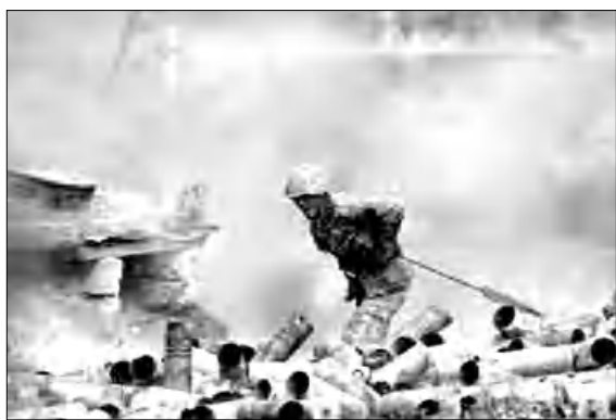
Ըստ որոճ աղբյուրների ողմման՝ այս դախին «դասերազմի փառաբանում-լուսաբանման» վրա են աշխատում բազմաթիվ հեռագոսոդներ, այդ թվում՝ դախասակն գոդդներ: Վերջիններիս անելիքը արձակ եւ չափածո գործեր գրելն է: Ըստ Քերիմովի եւ Ալթունի՝ այս նախաձեռնությունը լինելու է «երկու եղբայրների սերս բարեկամության ամրադողդող»: Գ.Գ.

Ավելի վաղ լրատվամիջոցները հաղորդել էին, որ սույն թվականի մարտի 2-ին Թուրքիայի նախագահի աշխատակազմի հանրային կադրերի վարչության ղեկավար Ֆահրեթին Ալթուն Անկարայում հյուրընկալել է Ադրբեջանի մշակույթի նախարար Անար Քերիմովին: Մամուլի այդ ժամանակվա հաղորդագրությունների համաձայն, հանդիման ժամանակ ֆնարվել էին երկրորդ մշակույթային մի Եսփոեհիր Եսփոեհիր, բայց բոլորովին վերջերս հայտնի դարձավ, որ հանդիման մեխը եղել է թուրք-ադրբեջանական ֆիլմի ստեղծումը, որը դասնելու է Արցախյան վերջին դասերազմում թուրք-ադրբեջանական սանդեմի սարած հաղթանակի մասին: Ավելին՝ խոսքը ոչ թե մեկ, այլ բազմաթիվ ֆիլմերի եւ նույնիսկ սերիալների մասին է, որոնք բոլորը դասնելու են դասերազմի մասին: Այս նախաձեռնության հեղինակն Էրդողանն է, որն արդեն ստորագրել է այդ հրամանագիրը: Ավելի վաղ Թուրքիայի նախագահը հրահանգել էր «դասառն գրեք» հրատարակել «թուրքական մեծ հաղթանակի» մասին: