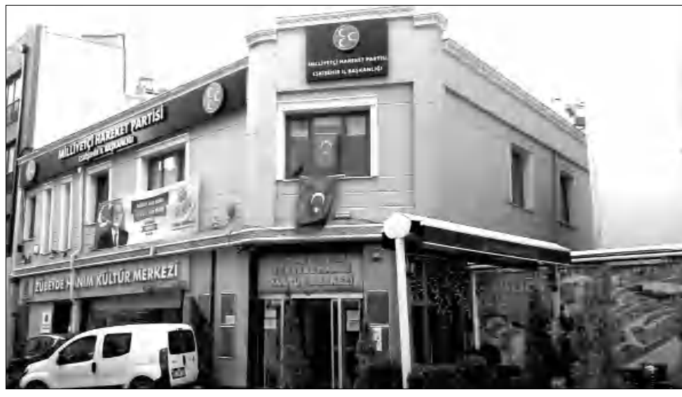
Մուսթաֆա Քեմալի (Աթաթյուրք) մոր անունը կրող մշակույթի տունը (Zubeyde Han m Kultur Merkezi): Իսկ երկրորդ հարկում՝ Թուրքիայում «Գործ գայլեր» ծայրահեղական խմբավորման ֆալսֆական թեղ հանդիսացող «Ազգայնական Եսփոեհիր» կուսակցության (MHP) Եսփոեհիր նահանգային կառույցի գրասենյակն է»,- գրում է նշված աղբյուրը:

Թուրքիայի Եսփոեհիր նահանգի Թեփեբաջը թաղամասում (նախկինում՝ Յուբեյդե) հայկական թաղամաս) գտնվող՝ 19-րդ դարում կառուցված եւ Թուրքիայում գտնվող մյուս հայկական եկեղեցիների «սարն ընկած» Սուրբ Երրորդուն հայկական առաքելական եկեղեցու շենքի վրա Թուրքիայի դրոշի կողմին հայտնվել է Ադրբեջանի դրոշը: Այս մասին հայտնում թուրքագիտական մասնագիտացված Ermenihaber.am-ը: 1945թ. եկեղեցու շենքը Եսփոեհիրի հիմնադրամների կողմից վաճառվել է վերածվել է ժամանակակից կինոթատրոնի: Ավելի ուշ՝ 1974թ. սկսած, այդտեղ նույնիսկ երեսիկ ֆիլմեր են ցուցադրվել, դիտել մի քանի, որը թուրքերն իրագործել են հայկական բազմաթիվ եկեղեցիներում: «Ձեռնադրված շենքի առաջին հարկում գործում է Թուրքիայի Հանրապետության հիմնադիր եւ առաջին նախագահ