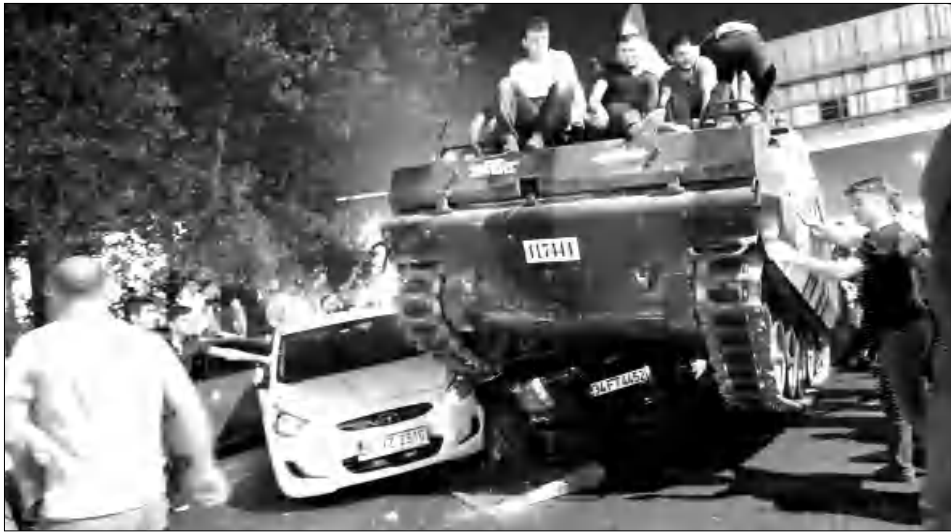
Տանկը ձխում է ակոսմեքնան

Եվ այսպէս, հեղափոխության փորձը ձախողվեց, ձախողվեց նաեւ Երդողանի դեմ ծրագրվող մահափորձը, որն այդ պահին զսնվում էր Բողոքի ֆաղափի