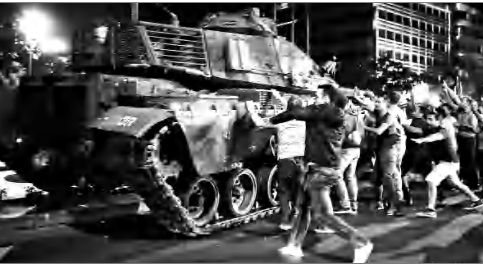
Մարդիկ փորձում են կանգնեցնել տանկը

«Մարմարի» հյուրանոցում (Թուրքիայի հարավ-արեւմուտքում): Որն էր այդ խռովության բարեկամը, որն զգուշացրեց Երդողանին հեղափոխության մասին: Ըստ օրինակի վարկածներից մեկի՝ Սիրիայի խմբիչի եւ Լաթափա ֆաղափներում ճեղակայված ռուսական ռազմական հե-