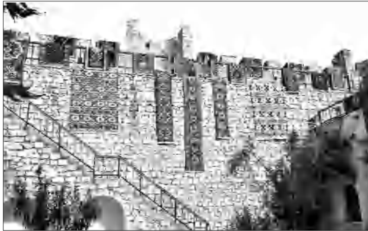
Մոտ 30 գորգագործ Հայաստանում է աղասան գտել: Մտածում են Շուտի արտադրամասի

«Միայն հայկական գորգերն են կրկնակի հանգուցով գործվում, որի շնորհիվ դարեր շարունակ դառնում էին: Դրանցից յուրաքանչյուրը դասնություն ունի, բոլորի