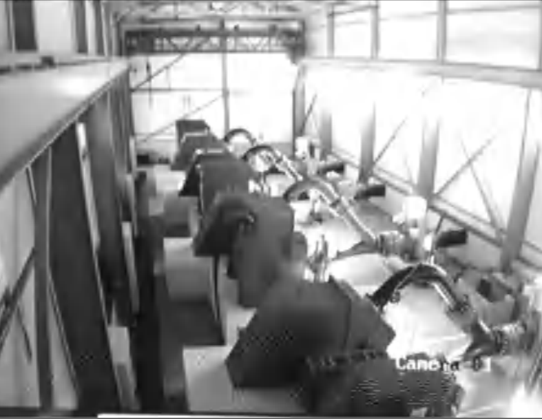
Արցախի «Ջերմաջուր» ՀԷԿ-ի մեքենայական սրահը մինչև արդամոնսաժումը

Ներկայումս գոյություն ունեցող հիդրոէլեկտրակայաններից Արցախի տարածքում է մնացել վեց ՀԷԿ՝ Սարսանգի, Գեթավանի, Թրդի կասկադի չորս ՀԷԿ-երը: Այսինքն՝ 192 ՄՎտ դրվածքային գունարային հզորությունից մեր տարածքում է զանգված 75 ՄՎտ գունարային հզորություն: Էլեկտրահաղորդման բարձրակույտ գծերը, որոնք Արցախը կապում են Մայր Հայաստանի հետ, անցնում են Լաչինի տարածքով: Զարգացման մեր կողմից կառուցված բարձրակույտ էլեկտրահաղորդման գծերի կարգավիճակն անորոշ է: Հիդրոէլեկտրակայանների հիդրոուժային սարքավորումները՝