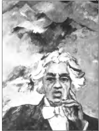
Արամ Խաչատրյան, 1982

Մանուկյանը Բոսոն (ԱՄՆ) է սեղափոխվել 1990-ական թվականներին, այնտեղ երկու ցուցահանդեսներ կազմակերպելուց հետո: Անցյալ տարի լույս է տեսել նրա «Հայկական սարագ» հասորը, որ երկար տարիների ուսումնասիրությունների արդյունք է: 1972-ին, Մոսկվայում «Հայրիկ» ֆիլմի նկարահանումների օրերին, նա մի գրախանութ է մտնում այնտեղ եւ այրումներ թերթիս դեմ առ դեմ գալիս հայկական սարագների, որոնք ներկայացված են լինում որդես թուրքական: Երեսն վերադառնալիս երգել է դաժարան մի այրում, որտեղ հայկական սարագները ճիշտ ներկայացված կլինեն ըստ Արեւմտյան Հայաստանի նահանգների: Այրումում, որը «Անտարես» հրատարակչատուն է լույս ընծայել եւ որի շնորհանդեսը Դեղզեմում կայանալու է գարնանը, նա ծանոթ ավանդական կողմն նաև ներկայացրել է մոռացության մասնավոր սարագներ, հնարավորության սահմաններում վերականգնելով դրանք: Ն.Ս.