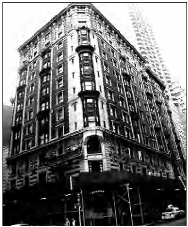
Սելիլ հյուրանոցի շենքը:

Մինչեւ բուժարան ուղեւորվելը Անդրանիկը մի մամակ գրեց Լեւոն Լյուլեճյանին. «Սիրելի Լեւոն, մեզի համար նոր տուն մը վարձե, ջուրէն վերադարձիս կփափաքիմ Ֆրեզոն բնակիլ։ Ֆրեզոյի օդն ու ջուրը ինձի համար ցաս նպաստաւոր են»։