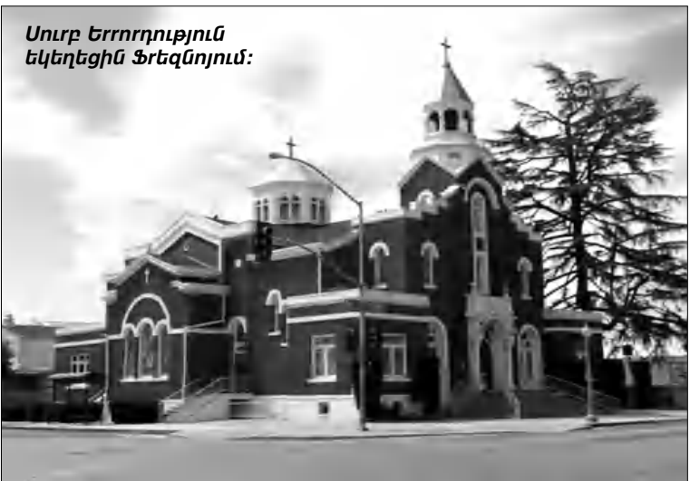
Սուրբ Երրորդություն եկեղեցին Ֆրեզոյում:

Որքան հայտնի է՝ Ֆրեզոյում Անդրանիկը հաջորդաբար բնակվել է երկու տներում։ Առա-