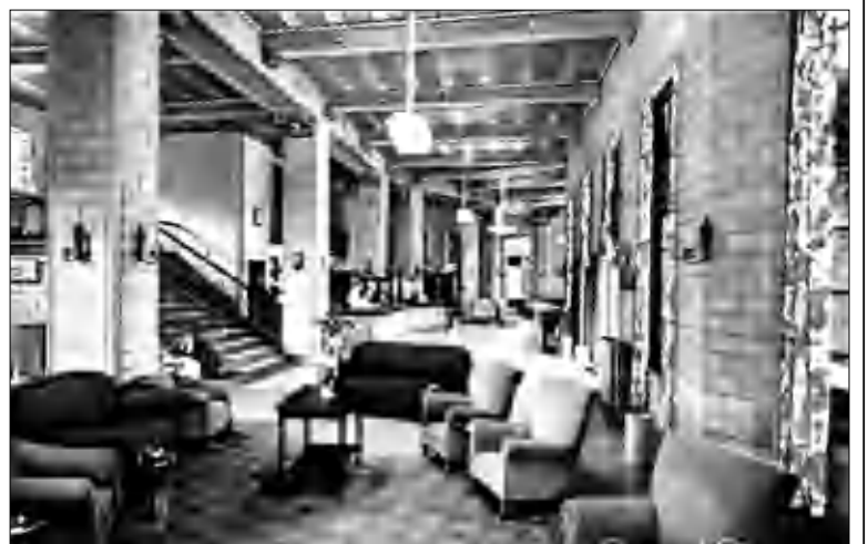
Ռիչարդսոն Սփրինգս հյուրանոց-բուժարանի ներքին հարդարանը:

Ֆրեզոյում դիմագրավելով մի քանի դժվարություններ, հասկառա առողջության վաթսրա-