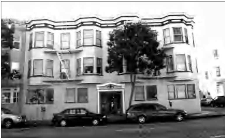
Անդրանիկի բնակած տունը Սան-Ֆրանցիսկոյում:

Ների համը ակամատեստ՝ արտադրական բնույթի հին շինություններ, ինչպիսիք սովոր ենք տեսնել Չարլի Չափիլիսի ֆիլմերում։