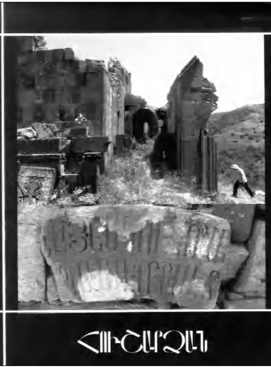
«Հուշարձան» տարեգրքի նոր համարը

Կարեն Ծերեթյանի և Հակոբ Սիմոնյանի «Ամուլսարի 2017 թ. ղեղումների նախնական արդյունքները» հոդվածում գիտական բարձր մակարդակով արձարծված են Ամուլսարում (Վայոց ձորի մարզի Գնդեվազ գյուղի հողատարած) նշյալ ՊՈԱԿ-ի և «Մշակութային ժառանգություն» ՀԿ-ի միացյալ արձագանքի կատարած հնագիտական հետազոտությունների արդյունքներն ու առավել նշանակալի գտածոները (վանակաթի մեծանան արհեստանոց, աբսոսակաթի կառույց):