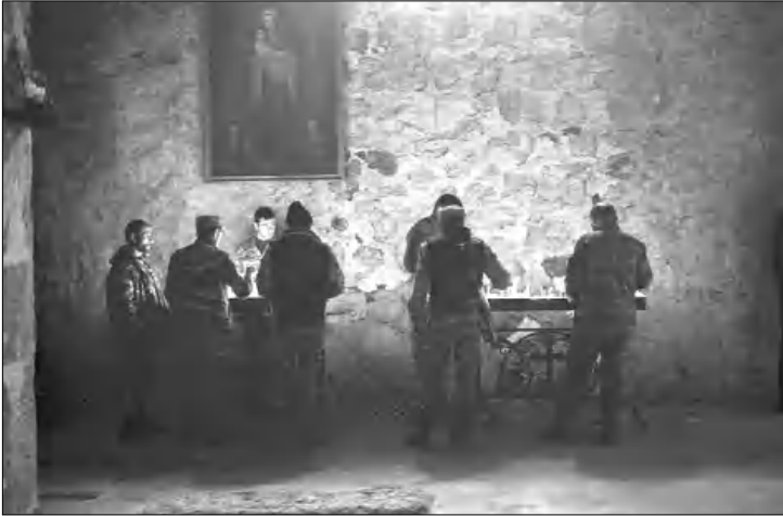
Մեկնելուց առաջ աղոթք՝ Դաղիվանքում...

Երբ երկու օր է մնացել, որ Քարվաճառը հանձ-