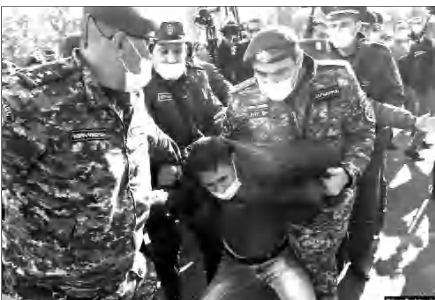
Հայաստան անցնեն, ու մեք, ցավալի, անմախադետ փախեփախ է Արցախից:

Մեր խնդիրը չհամարելով իժխանութեան հեքացմանը նոյաստելը կամ ընդդիմութեանն իժխանութեան բերելը՝ մէք ալելի մէք է հետաքրքիր այս իրավիճակից իրատեսական ելքեր փնտրելու խնդիրը, Բանի որ իրականում, մեմք ցատ ժամանակ չունենք, մինչեւ կիրակի զինուժը մէք է դուրս գա Արցախի տարբեր հատվածները: Հադրութի ու Զելքաճարի բնակիչներն իրենց զույգով, ունեցվածքով հերթ են կանգնել Հայաստանի սահմանին՝ որ