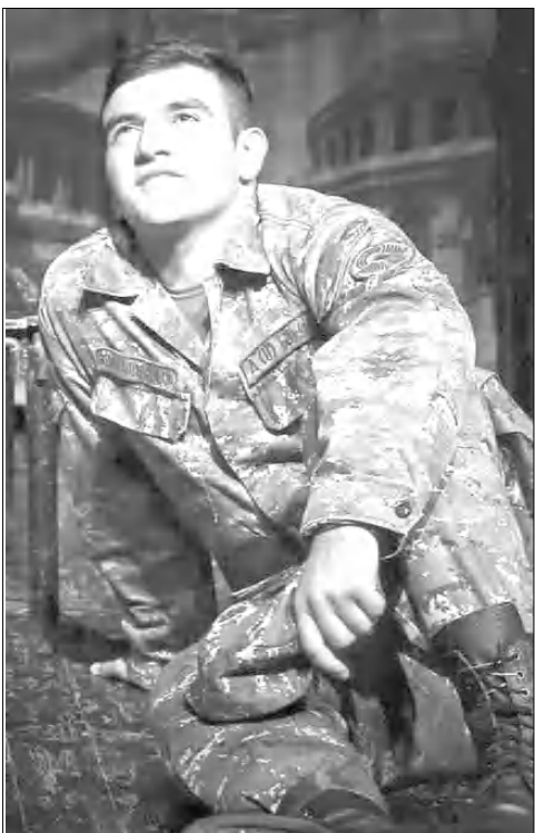
Լուսյը բացվելու հետ մեր թվածինը դրսևանում է, թեթե դու մեր տըր չես շինում: Քոնի բաղադրությունը արդեն սարհներն օծված է Արցախով: Քո բարձր, դոպիուրով փայլելը չեն ժամանում, բայց լուսն են: Տնով մեկ գնդացող ֆո Կոնաթը չի լավում, բայց դասերը դասել են դրա հիշողությունը, արձագանքը ցնցում է մեր մեքսը: Իմ այսօրը, որ թերթում դառնում է երեկ, արդարանի ժամանակ էլ չունի, Մոյեմբերի 7-ից հավերժականի սիրություն է, որին մեր ձենալ միայն Եռաբլուրում է արժանակած: