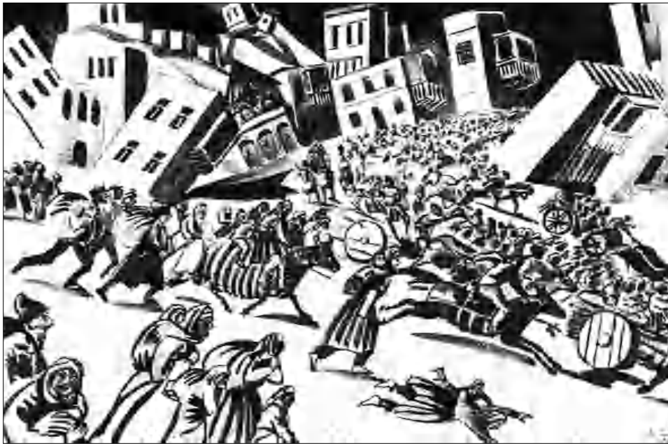
Սարսիրու Սարյան, «Երկիր Նաիրի» վեպի լուսկերպարումներից