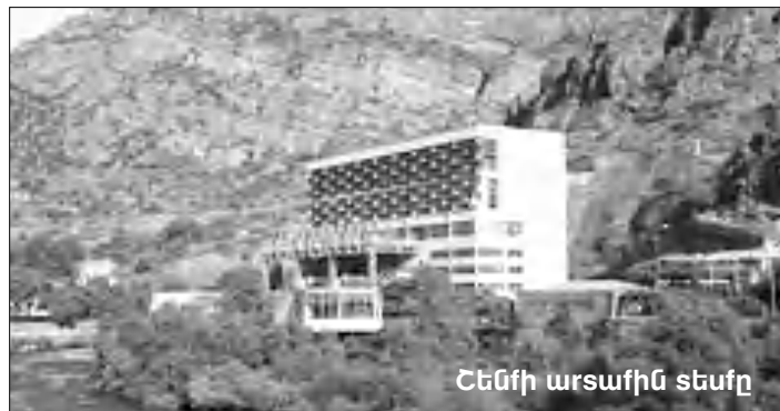
Ենեմի արտաքին տեսքը

Որոսանի հիդրոէլեկտրակայանների համակարգը բաղկացած է երեք էլեկտրակայաններից, որոնք գտնվում են Որոսան գետի վրա: 1970 թ. գործարկվել է Տարեւի հիդրոէլեկտրակայանը: