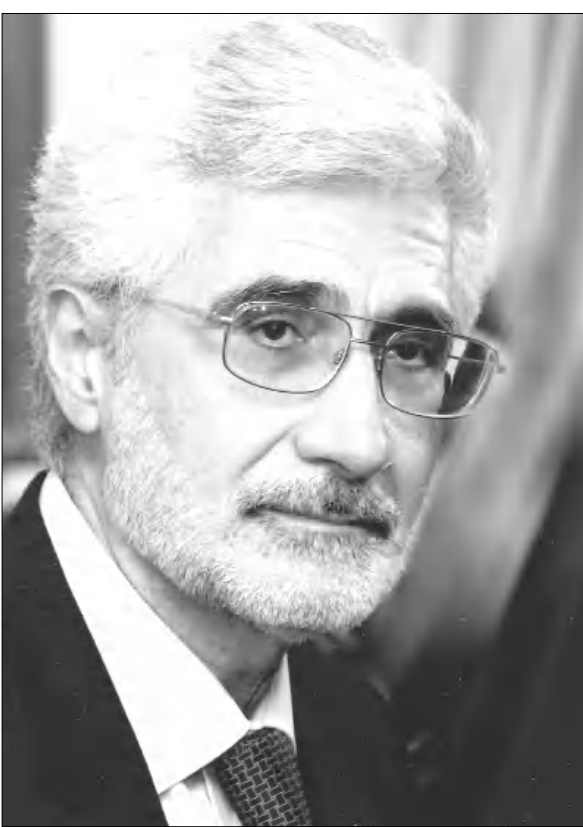
յում ի՞նչ դիմում եք: Ինչպե՞ս դասասխանել, երբ գերմանացիներն են սա թեմա դարձնում:

-Բուհարեսթանի եւ Բանդերբուրգի Լանդթագի ԱԲԴ խմբակցության մի շարք դասերի, Շեֆֆեյն Կոսթի, Շեֆֆան Կոյթերի, Անդրես Պալաուի, Անդրես Կալբիցի Արցախայցը, Արցախը ճանաչելու մասին հասակ արահայտությունը, ինչպես սղաղակում էր, երկուսերի՝ հոկտեմբերի 19-ին ֆունդամենտալ Բաբկուն: Ադրբեյջանի արտոնմանախառնությունը բողոքի մոտ հղեց Բուհարեսթանի ու Լանդթագին: Ծայրահեղ աջ ԱԲԴ-ն (Այլընտրանք Պերմանիայի համար) ամենամեծ ընդդիմադիր խմբակցությունը Բուհարեսթանում ունի նաեւ անդամներ, որ դասերում են Ադրբեյջանի շահերը: Սակայն սրա մասին որեւէ մեկը հիմա չի խոսում, ընդհակառակը, Պերմանիայում վերահիշյալ դասերի մասնակցության այցի ֆալսիֆիկացված շահերումը դեռ նոր է սկսվում: Իսկ երեւաթի՝ հոկտեմբերի 20-ին Բեռլինում գերմանական ՋԼՄ- ներից մեկի ներկայացուցիչը հասակ հարց ուղղեց ԳԴՀ-ում ՀՀ դեսպանին, դարգելու համար, թե արդյոք Հայաստանն է հրավիրող կողմը: Պերմանիայի հայերը երբեմն լայն սուր ու զգայուն են, մեծում են այս կուսակցության՝ Հայաստանին ու հայերին ի նպատակ արված յուրահայտությունը: Ակնարկածս նկատելի է սղաղակեց: Պարոն Ոսկանյան, հակադրում մեր լայնահայտում, մեր հայրենակիցներին Հայաստանում, Արցախում, Պերմանի-