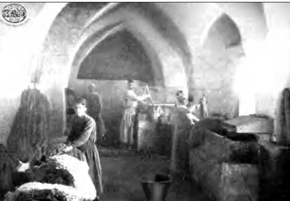
Հայ բանվորիկներ Ուրֆայում

Ամուսնու եւ եղբոր հետ 2011-ին հնարավորություն ունեցա այցելելու Թուրիա՝ ամերիկահայ «ուխսավորների» խմբի հետ, որի առաջնորդն էր այդ գործին անխոնջ նվիրյալ Արմեն Արոյանը՝ Վալիֆոնիայից: Ավելալում էին, որ կվերագնեմ մեր արաբկիրցի ծնողների բնակավայրերը, եւ երջանիկ՝ դրանց գտնելու համար: Բայց ինչու, որ դրանցում ոչ մի հայկական հետ չէր մնացել: Դրությունը գրեթե նույնն էր նաեւ մեր այցելած մյուս ֆաղափներում եւ գյուղերում: Կարսում օրինակ, մենք տեսնեմ հայկական եկեղեցու մնացորդները, որ վերածվել էր մզկիթի, մյուս վայրերում դրանք կան բազալիտի էին վերածվել, կան այրուների: Երիտթուրքի առաջնորդները այնդեպ էին կազմակերպել գեղաստանությունը, որ բնաջնջել էին ոչ միայն հայազգի բնակչությունը, այլեւ նա մակադոնային ժառանգությունը: Ամենացանկալին, անուշահոտ, հիշողությունը բնաջնջելու մեթոդայ թուրքերի գործադրած ջանքերն էին: