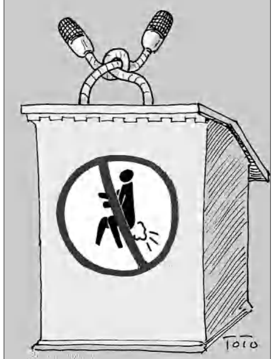
խաղացողներից մի ֆանիսին դասավորը, վայ, կներեք, ԱԺ նախագահ Արարատ Սիրզոյանը դաշտից, էլ կներեք ԱԺ դահլիճից, մինչև օրվա վերջ հեռացրեց:

Պարզվում է՝ խորհրդարանում «Երիշակ» բառը գիտեն, համեմայնդեղա՝ ԱԺ մեծամասնության ղեկավար Չրիշակ Կոնջոյանը հեճանադրա՝ 7-րդ գումարման 4-րդ նստաբազմի անդամիկ ֆառոյայի երկրորդ օրվա սրացման ժամանակ հիբեցրեց, որ ղեկավարողների կողմից ավելի աս գործածական ռուներն «ողիմոսու» բառի հայերեն համարմեքն է այդ բառը՝ ի գիտություն ղեկավարող գործածողների: Չնայած զանգվածաբար, նախկին լրագրող թե ոչ, մեր ղեկավարողներն իրենց ելույթներում շարունակում են հայերենի հերն անիծել, «բանը կայացնել նրանում» եւ այլ կողմի սխալներով խոսել: Հասկաղետ սահման չի ճանաչում «ոլ» բառի «որը» բացահայտայի փոխարեն զանգվածաբար գործածումը, որն անգամ վարչապետի բառադասարան է աննահանջ ներկա: Բայց Երիշակի բախճը բերեց կարծես խորհրդարանում, ֆանի որ Երիշակի կամ «ողիմոսուի մակարդակով նմարկում»՝ միմյանց ուղղված մեղադրանքն այս ֆառոյայում աս դահանջարկված էր: Ընդդիմությունը մեծամասնությանն էր ասում՝ Երիշակի մակարդակի նմարկում եք ծավալում, մեծամասնությունը՝ ընդդիմությունը: Ու անգամ ֆրեական եմբանակույթի վերաբերյալ օրինազանի՝ երկրորդ ընթերցմամբ նմարկման ժամանակ երեքաբար օրը Երիշակը հասավ գողական «ճաբոբկայի»՝ «էլ գող փիտ, էլ ֆաչալ շուն» արբերակով այնուե, որ անգամ