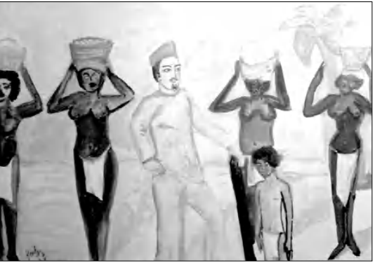
«Ազատուհան դառնալով Սուդանում» (գեղանկարը՝ Արծալի Բախչիյանի, 1987)