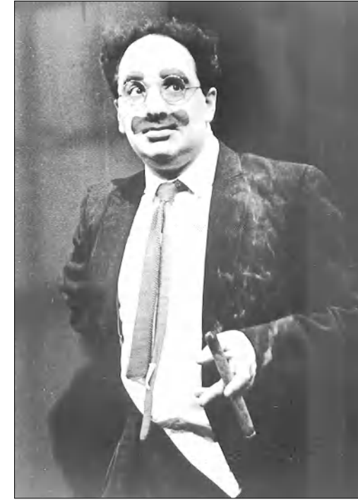
Լես Մարտեքնը Գրաւուչո Մարտի դերում

-Ես բավական ծանոթ եմ հայ ժողովրդական երաճոսությանը, բայց միայն որդեք ունկնդիր: Շաս եմ սիրում հայ սիմֆոնիկ կոմդոդիտորներին, որոնց գլխավորն, իհարկե, մեծն Արամ Խաչարսյանն է: Շաս փոքր ժամանակ նրա «Սերով դարը» լսելուց ի վեր ցաս եմ սիրել նրա երաճոսությունը, նրա մողալային գործերը, նրա հողինըրված յուրաքանչյուր նոսայի մեջ: Ես ինձ նույնացնում եմ նրա երաճոսությանը, նրա հնչյունին, չնայած իմ երաճոսական ոճը հազմադեղեղ է ակնարկում որեւէ «հայկականություն» կամ եքնիկ հնչողություն: Չեմ կարծում, որ լինի մի հայ կոմդոդիտոր, որի երաճոսությունն իմ մեջ չարձագանքի՝ Մանսուրյան, Հովհաննես, Հարությունյան... Դա իմ հողում է: Մեր հանդիսաստեւը ցաս հնաոճ է. նրանք ուզում են մեր կասարմամբ լսել իրենց իմացած երաճոսությունը, չնայած սովորաբար ես նրանց որոճ առողջ չափաբաճումվ սալիս եմ նաեւ անսովոր երաճոսություն եւս: Ցանկանում էի իմ նվազախմբի հետ կասարել խաչարսյանի առավել հայտնի գործերից, բայց ԱՄՆ-ում նրա երաճոսության վարձակալումը չափազանց թանկ է: Այդդեպ է նաեւ