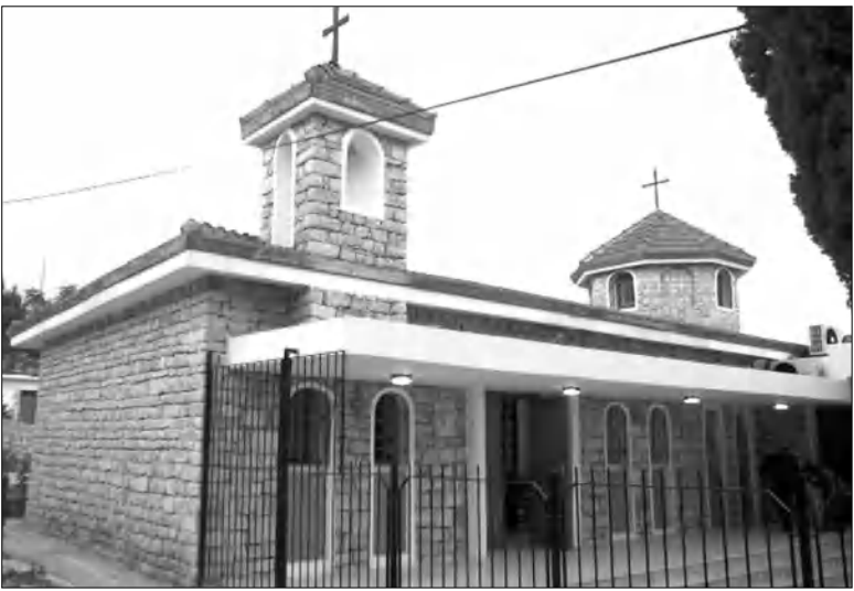
ՎաֆրՖլընի հայկական եկեղեցին

Ավելի քան մեկ դար անց, վերադառնալով տուն՝ վերադարձների սերունդները թանգարան են բացում՝ ոգեկոչելու և դաստիարակելու իրենց մշակույթը