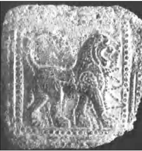
Վանի թագավորության գլխավոր զինանշանը՝ առյուծը

յոց իշխանի իր ժառանգումը, այլեւ նշանակվեց նաեւ Վիրի եւ Աղվանի իշխանության ներքին հայտնվեցին Հայաստանը, Վրաստանը, Աղվանքը եւ ողջ Կովկասը մինչեւ ճորտ ղեկավար: Հետագայում իրադրությունը փոխվում է եւ արաբները ներխուժում են Երուսաղեմ, Հայաստան, Քարթլի եւ կովկասյան այլ շրջաններ: Երուսաղեմի Հայ եկեղեցու առաջնորդը, կանխատեսելով արաբների մոտակա ներխուժումը Երուսաղեմ, ճանապարհորդում է Մեֆա, հանդիպում իսլամի հիմնադիր Մուհամմադ մարգարեին եւ նրանից ստանում հրովարակ, որն երազխավորում էր Երուսաղեմում բնակվող հայերի կյանքի եւ գույքի աղանդությունը: Միաժամանակ մարգարեն ճանաչում է Հայ եկեղեցու իրավունքները Երուսաղեմի բոլոր այն սրբատեղիների վրա, որոնք գտնվում էին նրա վերահսկողության տակ: Երբ խալիֆա Օմարը 638թ. գրավում է Երուսաղեմը, աղա նա իր նոր հրովարակով հաստատում է բոլոր այն երազխիները, որ Մուհամմադ մարգարեն սվել էր Երուսաղեմի Հայոց մասրիարությանը: Հետագայում Սալահ ադ-Դինը նույնպես ճանաչում է Երուսաղեմի Հայ եկեղեցու բոլոր այն իրավունքները, որը նրան սվել էին իր նախորդները: