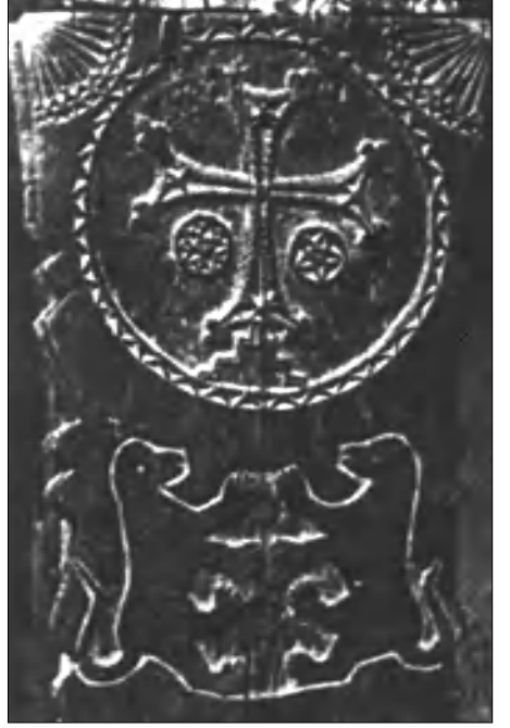
Բագրատունյաց հարսության զինանշանը

2. Ռուսիայի ուղղափառության ընդունումը եւ հայագահ Աննա իշխանուհու դերը: Սկզբնական շրջանում Բյուզանդական կայսրությունը կառավարում էին համակարգ երկու հայ եղբայրները՝ Բարսեղ Երկրորդ Բուլղարաստանը եւ Կոնստանտինը: Հայերի ղեկավար դերակատարումը չի սահմանա-