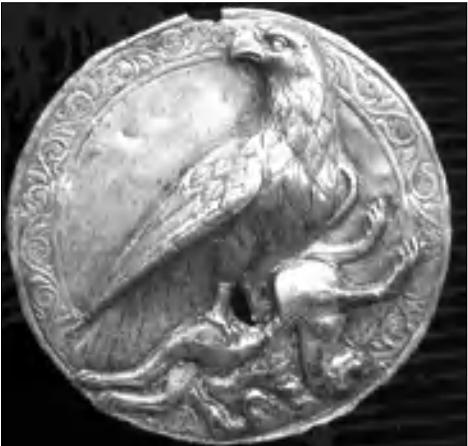
Արածիսյանների թագավորության խորհրդանշանը՝ Արծիվը, մագիլների տակ թռչող թռչունները

Հետագա սարհներին սրվում են հարաբերությունները Արաբական խալիֆայության եւ Հայաստանի միջեւ, որի արդյունքում, ի վերջո, 885թ. Հայաստանին հաջողվեց վերադառնալ իր անկախությունը: Արաբական խալիֆա Մուսաբինը ստիպված հաշտվում է կասպից իրողության հետ եւ Առաջնորդում ճանաչել Հայաստանի թագավոր, նրան թագ ուղարկել, ինչպես նաեւ արժային վայել