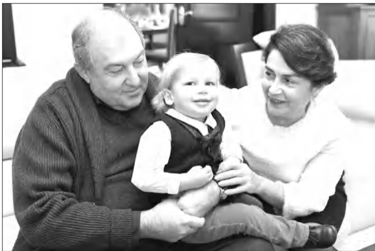
Նախագահը թիկնոջ եւ թոռան հեթ

- 2015 թ. ընդունված ՀՀ նոր կամ նորացված Սահմանադ- րությունը, որը նախկին նա- խագահը ճեթել-կարել էր սվել իր հազին, այթմ սուր բեթեռա- ցումների եւ կորոնաֆաղաֆա- կան թայմանքներում ավելի ցցուն երեսակ է հանում իր ան- համադասախանությունը ներկա թահանքներին՝ թեթա- կան իշխանական թեթերի մի- ջեւ հակակեթոների խախս- ման, այդ թվում՝ նախագահի իրավասությունների սահմա- նափակման սեսակեթից: Ի՞նչոթես եթ զնահասում այս ի- րողությունը, ի՞նչոթես կարելի է դուրս զալ այս վիճակից: