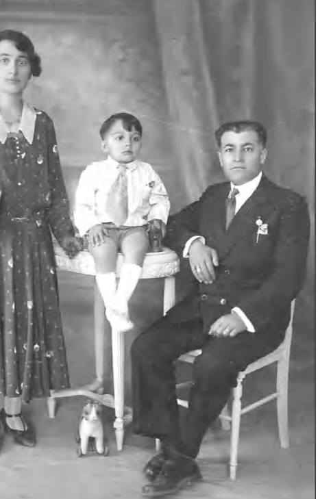
Գայրը, մայրը, եղբայրը

Մեր հերթական հեռախոսազրույցին սիկին Ռոզիին ուզում էր զոհանք նաեւ հոր հավանական ծննդավայրի՝ անցյալում համանուն գավառի կենտրոն եւ բավական հայտնի բնակավայր եղած Ճահուկ գյուղաֆաղափի մասին, երբ անբացատրելի մղումով որոշեցի նախքան այդ մի անգամ էլ վերանայել զոհանքան-վիճակագիր Արո -ի (Զովհաննես Տեր-Մարտիրոսյան) «Գայր-թուրական ընդհարումը Կովկասում (1905-1906թթ.)» գրքում նկարագրված իրադարձությունների՝ Ճահուկ գյուղի հասկածը: Գտա Ճահուկում թուրքերի իրականացրած զազանությունների մանրամասն նկարագրությունները, իսկ զրքի վերջում ներկայացված Ճահուկից 51 զոհերի ցանկում՝ 35-րդը անհավաստիորեն... «Յովհաննեսեան Մարգար» անուն-ազգանունն էր (էջ 461). նա զոհվելու օրը, 1905 թվականի մայիսի 12-ին, եղել է 45 տարեկան: Այլեւս կասկած չմնաց, որ երգչուհու հոր ծննդավայրը հենց Ճահուկ ավանն է եղել: