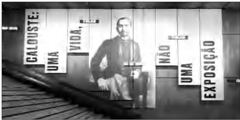
«Պալուս: Մի կյանք, բայց ոչ սոսկ ցուցադրություն»

անգամ էր, որ այն ներկայացվում էր երեք լեզուներով՝ Պորտուգալերեն, անգլերեն եւ հայերեն: