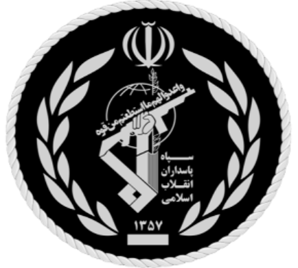
Իրանի ԻՂՊԿ «Ալ-Քուդս» ուժերի զինանշանը

Տարածաշրջանում, մեր հարեանուրջամբ, խիստ լարվում է օղերաշիվ-ֆաղափարական իրավիճակը, որը կարող է