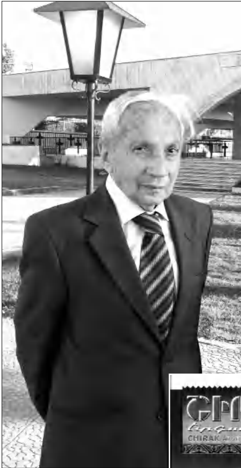
Նր կա: Եվ դա այդ երգարանների մեծագույն արժանիքն է:

Այդ երգարաններում հայ երաժշտական ընթացիկ կյանքի հինգ սասնյակ սարված ժամանակագրությունն ու սարեգրությունը: