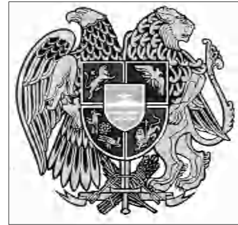
Այժմ գործածական արբերակներից մեկը:

Ինչու է այդպես սացվել, զիտակցված է դա արվել, թե՛ անփութության հե-