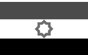
«Ալ-Ջուդա» (Երուսաղեմի ուժեր) ղրուց

2019 թ. հոկտեմբերի 3-ին Իրանի Իսլամական Հանրապետության Իսլամական հեղափոխության դասաղանների կորուստի (ԻՀԴԻՍ) հետախուզության ղեկը՝ Հուսեյն Թախթաբայանը, որ դեմության հասուկ ծառայություններին հաջողվել է խափանել արաբա-իսրայելական հասուկ ծառայությունների փորձը՝ ֆիզիկաղես վերացնել Իրանի ԻՀԴԻՍ հասուկ ստրաբաժանման «Ալ-Ջուդա» (Երուսաղեմի ուժեր) հրամանատար, գեներալ Ղասեմ Սուլեյմանին: Ձերբակալվել են մահափորձ իրականացնող երեք կասկածյալներ: