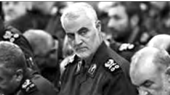
Իրանի ԻՀԴԻՍ-ի «Ալ Ջուդա» ուժերի հրամանատար Ղասեմ Սուլեյմանին

Նույն օրը երեկոյան գեներալ Սուլեյմանին հանդես եկավ Իրանի «Ալ-Ալամ» հեռուստաղիով ել դաստատեղ, թե ինչպես հաջողվեղ խափանել իսրայելական հետախուզության «Մոսադի» ել որոշ արաբական հասուկ ծառայությունների համատեղ օղերաղան՝ իր անձի դեմ մահափորձ իրականացնելու նղատակով: