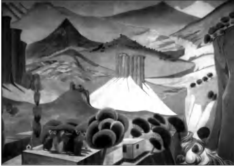
Ս. Սարյան. «Հայասան»

Մարտոս Սարյանի մասին գրել էին «Ազգ» թերթի սեղանաբերյան համարներից մեկում: Հոդվածի կենտրոնում հարեանցի նշվել էր իմ՝ նրա անունը կրող թանգարանի մասին: Տեղեկություններ են այժմ համառոտ ներկայացնել 38-40 տարիների իմ գործունեության որոշ հանգրվաններ, ավելացնելով, որ այդ բոլոր տարիներին աշխատելու են թանգարանում: