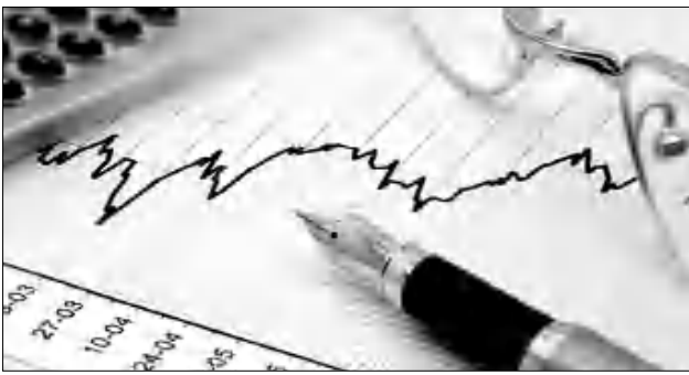
2017-2018թթ. ընթացքում՝ ղուտ եռամսյակների:

Հետաքրքրական է, թե ինչպե՞ս կարելի է նման վիճակագրությունը ներկայացնել որդես նվաճում, այն