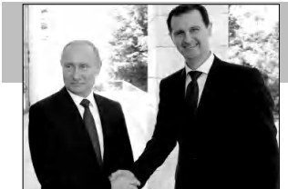
Նախագահ Պուտինը սուկ Բաշար Ասարի վարչապարդին չի պաշտպանում

2000-ականների սկզբին օտարվեց, աղանոսավեց ու վաճառվեց. մոտ 6000 տոննա խողովակ ու միացման այլ համակարգեր գնացին «անհայտ ուղղությամբ»: Ցավոք արի, այսօր ֆչեր են խոսում այդ կեղտոտ գործարի մասին, որը համազոր է դեմոկրատիայի նոյնակումը: Ինչեւէ, անցյալն անցյալ է, հիմա, երբ երեք տասնամյակ միայն ողբացել են, ժամանակն է ուշիք բերելու Սեւանը, լիճը, որն 90-ականներին ու 2000-ականների սկզբին սնեց ու բարդի ուղիղ իմաստով սովամահությունից փրկեց Հայաստանի ամբողջ բնակչությանը, հե՜տազայում՝ զգալի մասին: Առաջին ֆայլերից մեկը դեմք է լինի հե՜տաւնությունը՝ կոլեկտորների անհե՜տացման հե՜տերով՝ ո՛վ, ո՛ն հե՜տ, ե՛րբ, որին զուգահե՜տ դեմք է ձեռնարկվի կոլեկտորի անցկացման նոր գործընթացը: Որքան էլ այն իրենից մեծ ծախսեր ենթադրի, անոյայման դեմք է իրականացվի, որովհետեւ մաքուր Սեւան ունենալն այսօր մեզ համար արդեն ռազմավարական խնդիր է: Դրանից հետո, դեմք է անոյայման լուծել արդեն բազմիցս արծարծված ջրառի հարցը, որը սարիներ շարունակ ուղղակի հիվանդության շենքին է հասցրել լիճը: Ցավալի է, բայց մինչ Բնադառնության նախարարն Ազգային ժողովում լսումներ է իրականացնում, նույն դաժին Սեւանի ջուրը ողողում է Արարյան դաշտը: Ներողություն, բայց դա ջուրծեծոցի է. ժամանակի սղանդ: Անուրե՜տ, Արարյան դաշտի ոռոգման հարցը եւս կարելու է մեզ համար, բայց, ինչպես արդեն մեկ են, դրա համար բազմաթիվ այլ աղբյուրներ կան, օրինակ՝ Կարսի ջրամաքարը, որին նախորդ հոդվածներում անդրադարձ չի կատարվել: ➔3