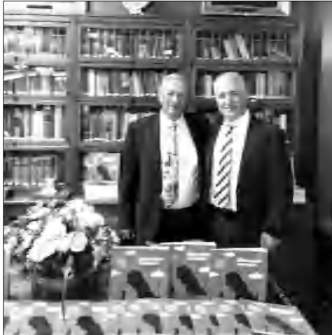
Գավաթյանը (մայիսից) Դերենցի հետ