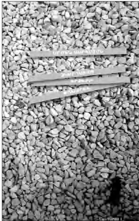
Առում հավաքողները գարունները սրբեցին սարսնու հիմա սառնամանիս ձեռնոցներ չունի

Արմեն Սարգսյանի կարճառոտ բանաստեղծություններն էականորեն շարքերով են այդ խորհրդածություններից թե՛ իրենց կառուցվածով, թե՛ ոճաբանությամբ, թե՛ զուտ եւ նրբին ճաշակով, թե՛ խորությամբ եւ թե՛ անստիպելի գեղեցկությամբ: Ի դեպ, «ու՛նայնություն» մակարդակն էլ հասցված է գրոյի: