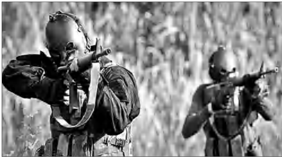
Կարճ սեղեկացվություն (այս հարգարժան մարդիկ վաղուց գաղտնիության շղարհի սակից դուրս են եկել):

ները եւ նմանակեր, սկզբունքայինությունը եւ նույնափող աշխարհափայտացր, բարձր ինտելեկտը: Այն աշխարհում, որտեղ աղաչում է հետախույզը, գիտելիքները բարձր արժեք ունեն եւ հաճախ կարող են առեւտրի առարկա դառնալ, այդտեղ կան խաղի բավական բարդ կանոններ: Մյուս կողմից կարելի է դիտել, որ հետախույզության մեջ ոչ մի բարդ, արտաքին եւ գերբնական բան չկա, չնայած մի խորհրդավոր շղարհ է ծածկում այն: Անգլերեն «intelligence» բառն ունի մի ֆանի թարգմանություն՝ ինտելեկտ (միտ), ինտել, մտավորական, մտավոր ունակություններով արարած, ուղեղ, ինչպես նաեւ՝ հետախույզություն: Այսինքն, այլ կերպ ասած, այդ բառի իմաստը (intelligence) ասոցացնում է հասկանալու ընդունակությունը, մեթոդի կառավարումը, ինչպես նաեւ գիտելիքի դիստրիբյուցիոնը որդես աշխատանքային նյութ, հումք: Հետախույզություն (intelligence) բառի համար Արեւմուտքում հետախույզական բացատրություն կա՝ հետախույզությունը դա այն ստացված սեղեկացվությունն է, որը չի կարող մնալ մեկ անձի ուղեղում, այլ փոխանցվում է մեկ ուրիշին: Եվ այդ փոխանցված սեղեկացվությունը հետախույզությունում գնահատական է ստանում այն արժեքավոր է, թե արժեքավոր չէ: Երբեմն, ցավով սրի (դա կարելի է ղեկավարների սկզբունքայինությունից) հետախույզության կարգերում են հայտնվում խնամք-ծանոթ-բարեկամ սկզբունքով մարդիկ, որոնք 100 կիլոմետր հեռավորությամբ հասնու ծառայության կողմից չափի անցնեն: Դրանց նույն է արտասահմանյան որեւէ երկրում