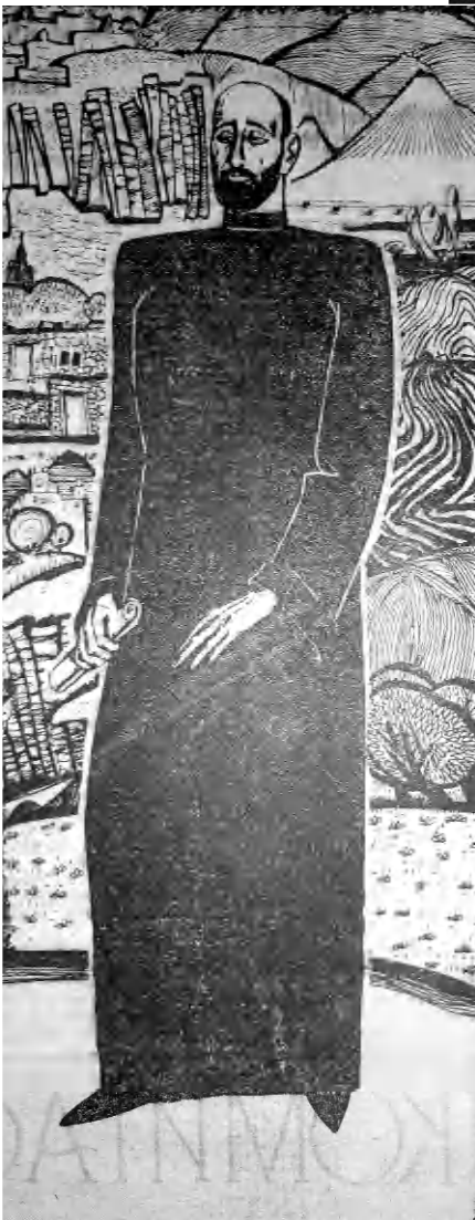
Թողել են ու եկել միջեր ու այգիս, ֆանի որ ախ կանեն, կու ֆաղուի հոգիս...

խարդական ուժը Չի կարող իմանալ, թէ նա ինչպէս կարող էր իր երգերով ունկնդիրներին տալ հայ ժողովրդի ամբողջ դասունութիւնը: Կոմիտասը եղել էր հեղինակը ժողովրդական երգերի, բայց առաւելապէս եղել էր, իր երգեցողութեամբ, ժողովրդի յոյսերի, յուզումների, ուրախութեան ու տառապանքների թարգմանը, բուն երգիչը: Այդ օրը, երբ Կոմիտասը երգում էր. «Կոռնկ, ուստի՛ կուգաս, ծառայ եմ ձայ-