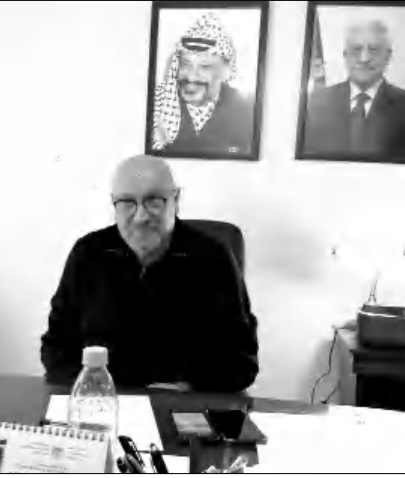
Շարուն իշխանութեան եկաւ, փակելով «Արեւելի տունը» (Orient House), եւ այդ ժամանակ է, որ նախագահ Մահմուտ Արդաաս զիս դեպոզիտ նշանակեց:

Տարբերակ եւ Ֆէյսալ Ալ-Հուսէյնի հետ էի: Զուտ մէջ է երթալի իր հետ, երբ նամակ ստացայ ԱՄՆ-ի ներգաղթային վարչութեան, որ մէջ է երթալի ստանալու ամերիկեան հոյատակութիւնս, որովհետեւ ամէն դեպոզիտին մէջ է ունեցայ երկրորդ անձնագիր՝ տեղաբնակեան եւ աշխատանքի դիմումներ համար: Այնպէս որ Ֆէյսալ Ալ-Հուսէյնի արտօնեց որ երթամ եւ ամերիկեան ֆալստինեան ստանամ: Ան մեծ յաջողութիւններ անձնաւորութիւն էր: Յնուած էի լսելով Ֆէյսալ Ալ Հուսէյնի մահը: Անոր մահուանէ ետք, Արիւն